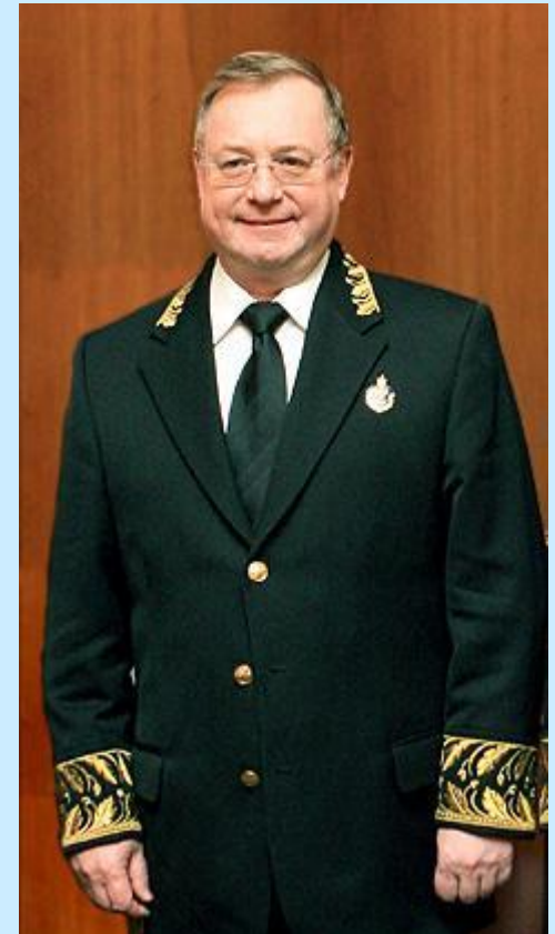
Степашин Сергей Вадимович