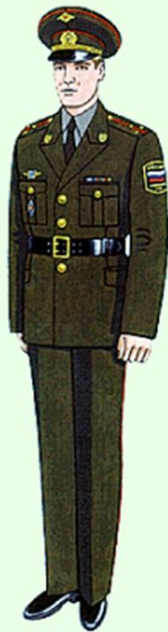
Повседневная для строя