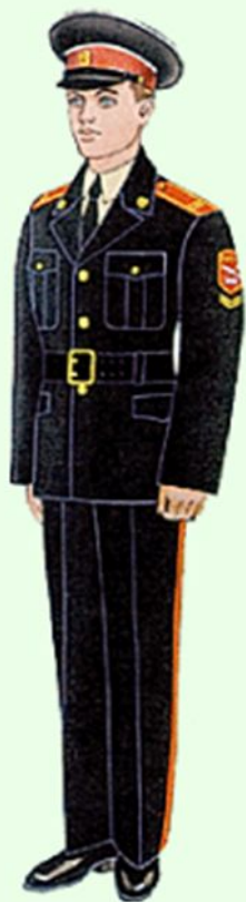
Летняя парадная для строя