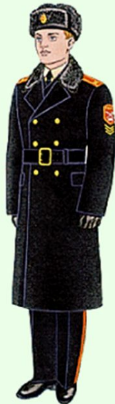
Зимняя парадная для строя