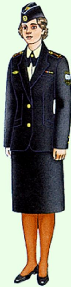
Летняя повседневная вне строя в ВМФ