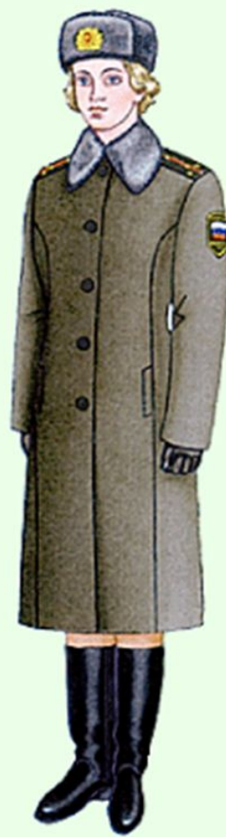
Зимняя повседневная вне строя (кроме ВМФ)