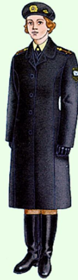
Зимняя повседневная вне строя в береговых войсках ВМФ