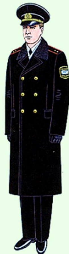
Парадная для строя и вне строя в береговых войсках