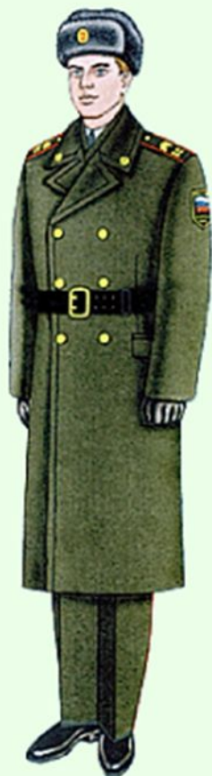
Парадная для строя