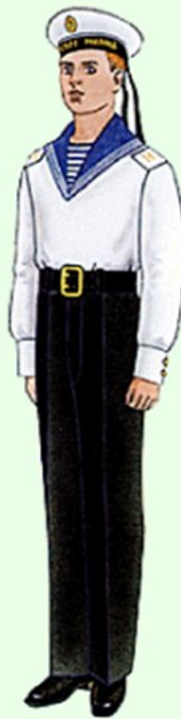
Летняя парадная для строя и вне строя