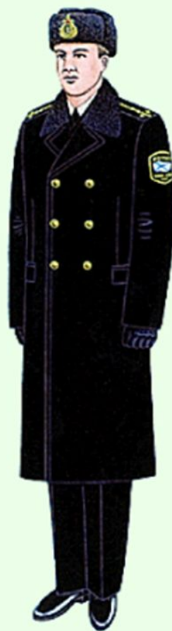
Повседневная для строя и вне строя