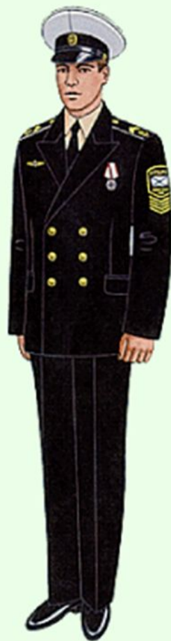
Парадная вне строя курсантов