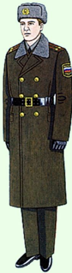
Повседневная для строя