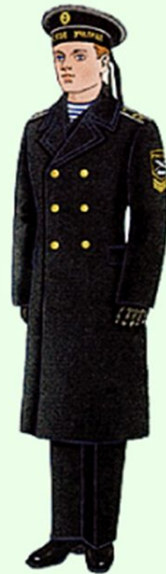
Зимняя парадная вне строя