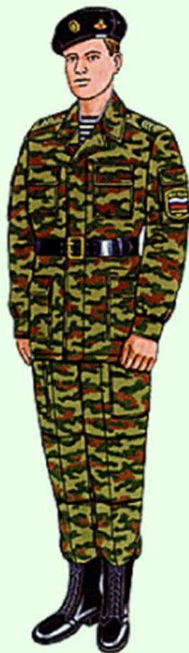
Повседневная для строя и вне строя в береговых войсках