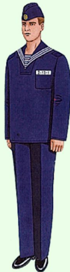
Повседневная для строя и вне строя