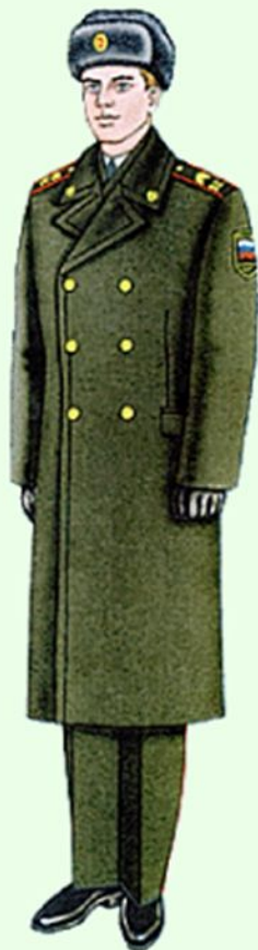
Парадная вне строя