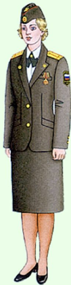
Летняя парадная для строя и вне строя (кроме ВМФ)