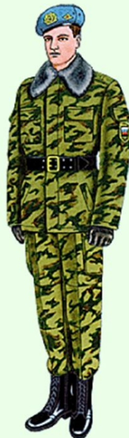
Парадная для строя в ВДВ