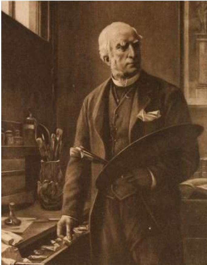
Художника Джона Хорсли

Настоящая же серийная открытка появилась тоже в Англии, в 1840 году, когда государственный чиновник сэра Генри Коул придумал для близких оригинальное поздравление – рождественскую открытку с рисунками художника Джона Хорсли, своего друга.