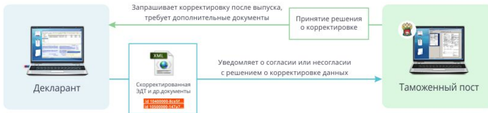
Корректировка после выпуска по инициативе таможенного органа