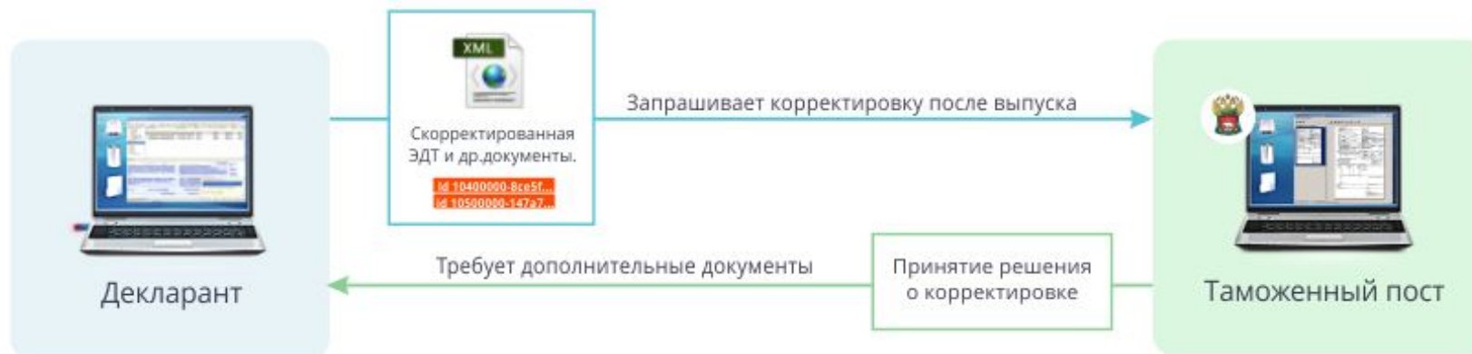
Корректировка после выпуска по инициативе декларанта