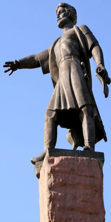
Основателю Горо Воеводе Дубенско

Выдающаяся и интересная личность, основатель Красноярского острога. Он был прислан из Москвы, чтобы подыскать место для строительства на Енисее нового острога. Высадившись на берег с тремя сотнями казаков и оглядев окрестности он повелел: «На этом месте в Качинской землице на Красном Яру острог поставить!»