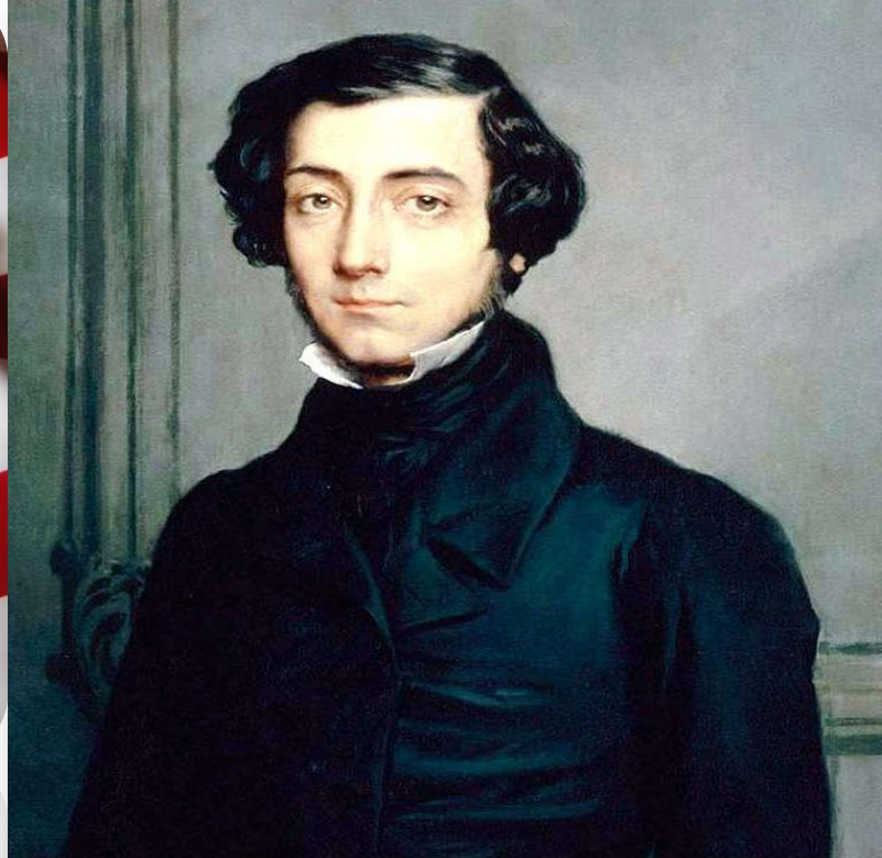
Алексис де Токвиль