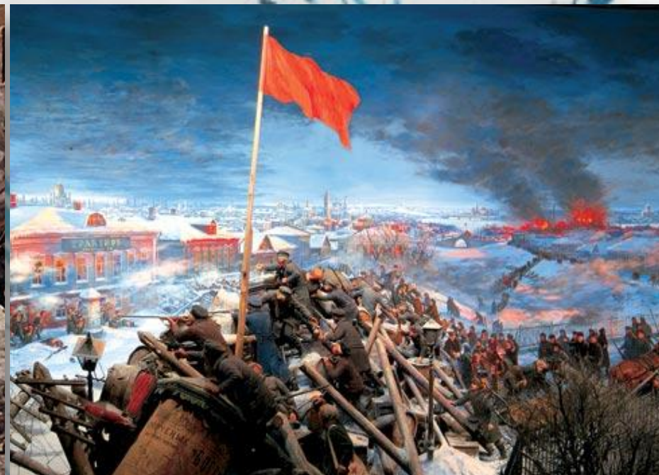
Декабрьское вооруженное восстание