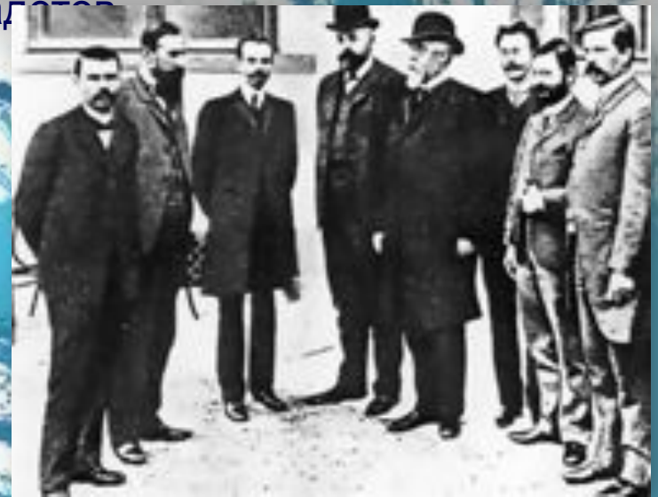
«Союз 17 октября»