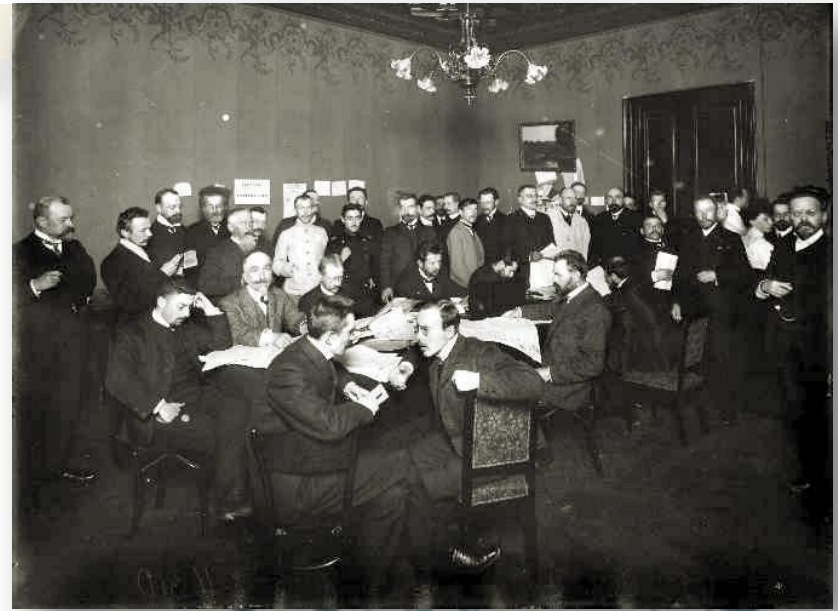
Заседание руководства партии кадетов

5. Программа октябристов более консервативна, программа