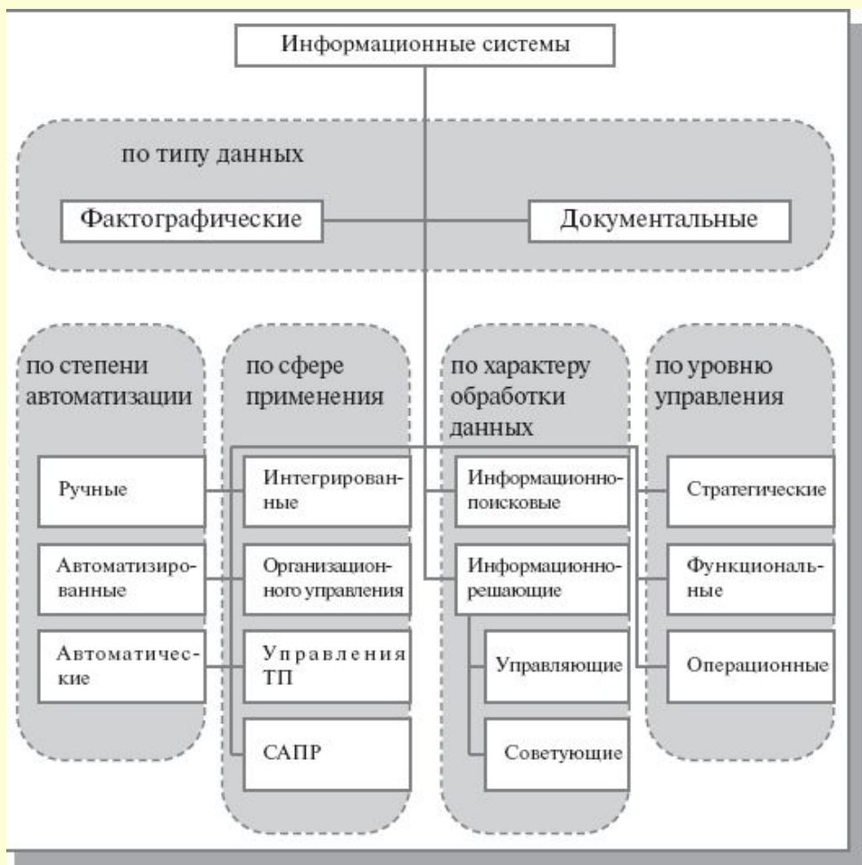
Рис.1 Классификация ИС

Информационная система (ИС) – это вся инфраструктура предприятия, задействованная в процессе управления всеми информационно-документальными потоками.