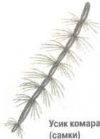
Усик комара (самки)