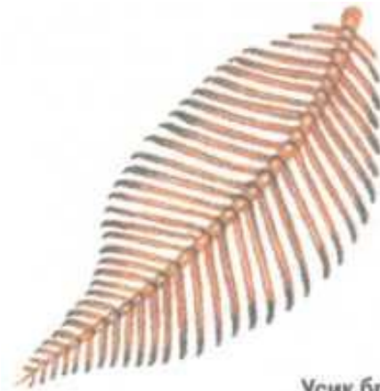
Усик бражника (самца)