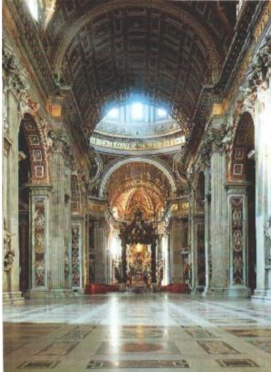
Внутренняя отделка базилики