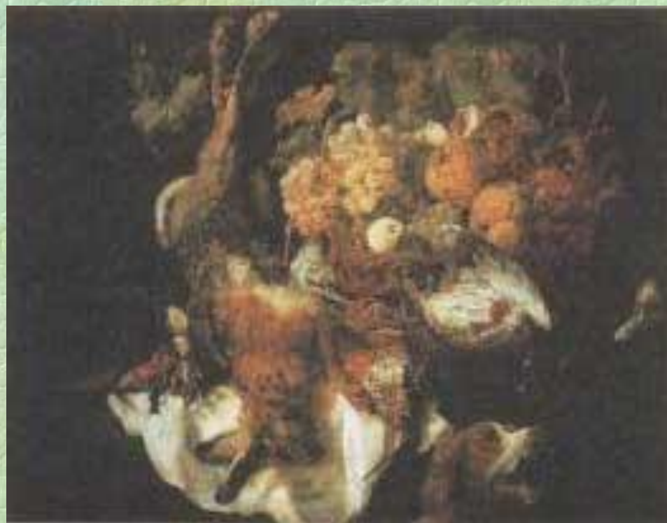
Ян Фейт. Натюрморт с собакой.

Манера фламандского художника Яна Фейта более изысканна, чем у его учителя Снейдерса. Подчёркнуто скромные по композиции и размерам произведения Фейта интересны гармонией сдержанного света, тонких оттенков коричневых, зеленоватых и светло-серых тонов. Это несравненная чуткость живописца сближает его с голландскими мастерами.