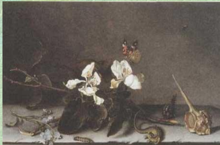
Балтазар ван дер Аст.

В натюрмортах, относящихся к началу XVII столетия, предметы расставлены в строгом порядке, словно экспонаты в музейной витрине. В подобных картинах детали наделяны символическим значением. Яблоки напоминают о грехопадении Адама, а вино град — об искупительной жертве Христа. Раковина — оболочка, оставленная, когда то жившим в ней существом, увядшие цветы — символ смерти. Бабочка, родившаяся из кокона, означает воскресение. Таковы, например, полотна Балтазара ван дер Аста.