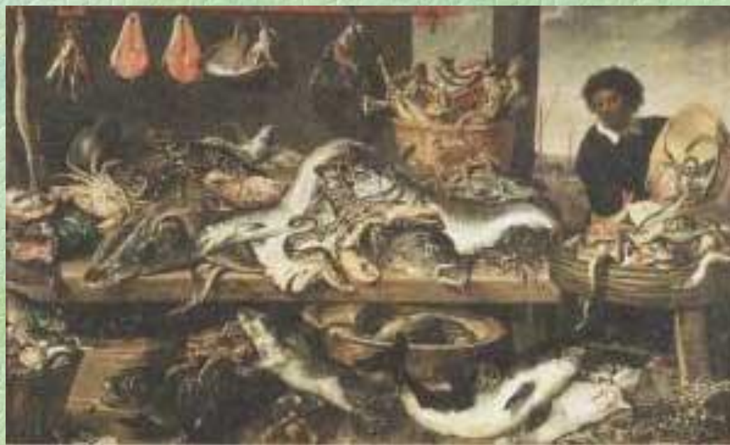
Франс Снейдерс. Фламандская школа. Рыбная лавка.

Его расцвет начался в Голландии, где Реформация, запретив художникам писать картины на религиозные темы, вынудила их искать новые направления.