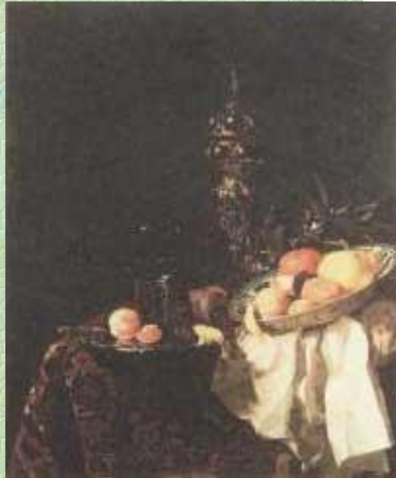
Виллем Калф. Десерт. Ок.1659г.

На картинах Абрахама ван Бейерна и Виллема Калфа изображены грандиозные пирамиды из дорогой посуды и экзотических фруктов.