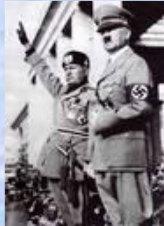
Б. Муссолини и Адольф Гитлер