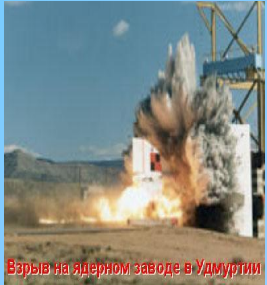
Взрыв на ядерном заводе в Удмуртии