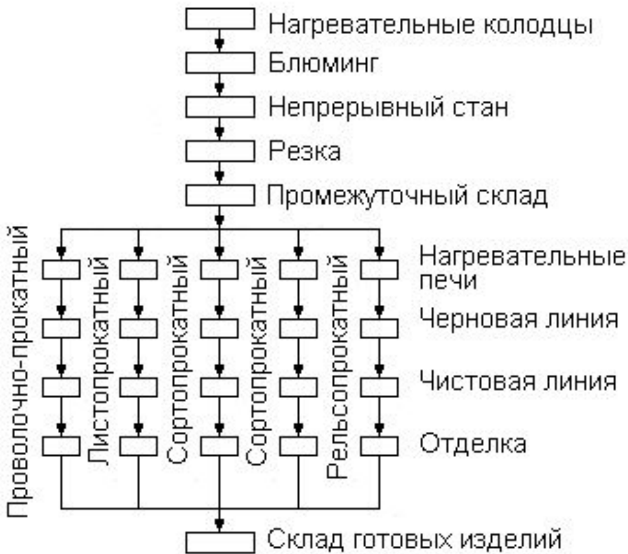
Схема технологического потока прокатных цехов