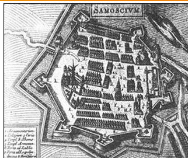
Замостє, твердиня на Холмщині, її облягав Богдан Хмельницький 1648 р.

Саме в цей час, 1 жовтня 1653 р., Земський собор у Москві вирішив прийняти Україну під протекторат Московії.)