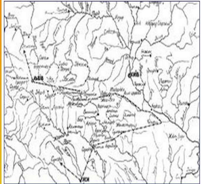
Мапа України в половині XVII в. Напрямки походів Хмельницького зазначені крижованою лінією.

Хмельницький вислав знову збройну експедицію на Молдаву нагадати воєводі його обіцянку. І справді, 30 серпня відбулося весілля Тимоша з Розандою. Польщі не сподобалося що молдова дружить з Україною і почала війну, в якій хмельницький програв.)