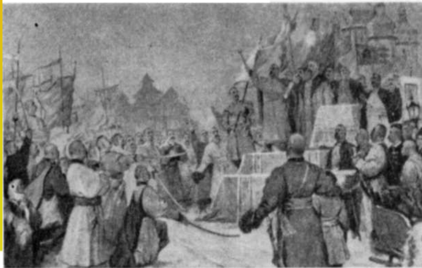
Переяславська рада 1654. Картина худож- ника М. Г. Дергуса (у співавторстві). 1954.

Угода між російським царським урядом і українською козацькою старшиною, комплекс документів, які регламентували політичне, правове, фінансове і військове