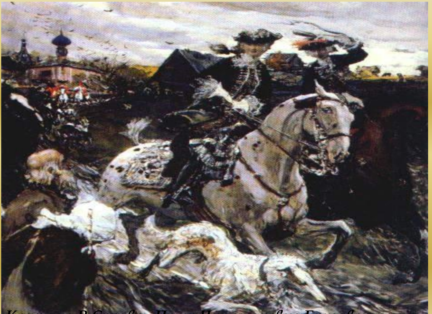
Картина В. Серова «Петр II и цесаревна Елизавета на псовой охоте»