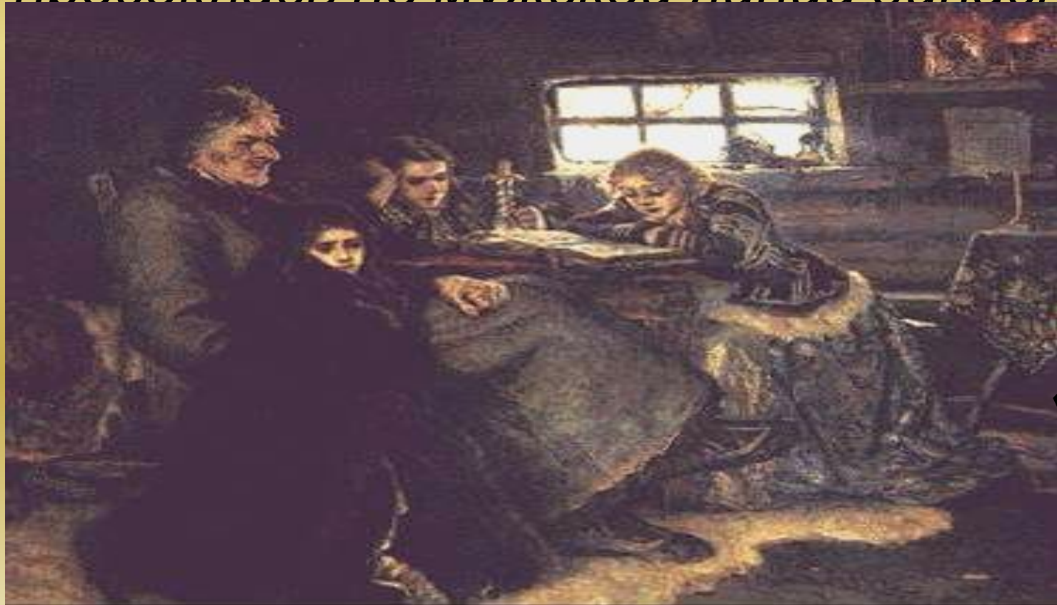
Картина В. Сурикова «Меньшиков в Березове»

Меншиков был смещен со всех постов, лишен всего состояния и сослан в Сибирь. Огромное влияние на Петра оказывали Долгорукие и Голицыны, но и их постигла неудача. В январе 1730 г. Петр заболел и умер. С ним пресеклась по мужской линии династия