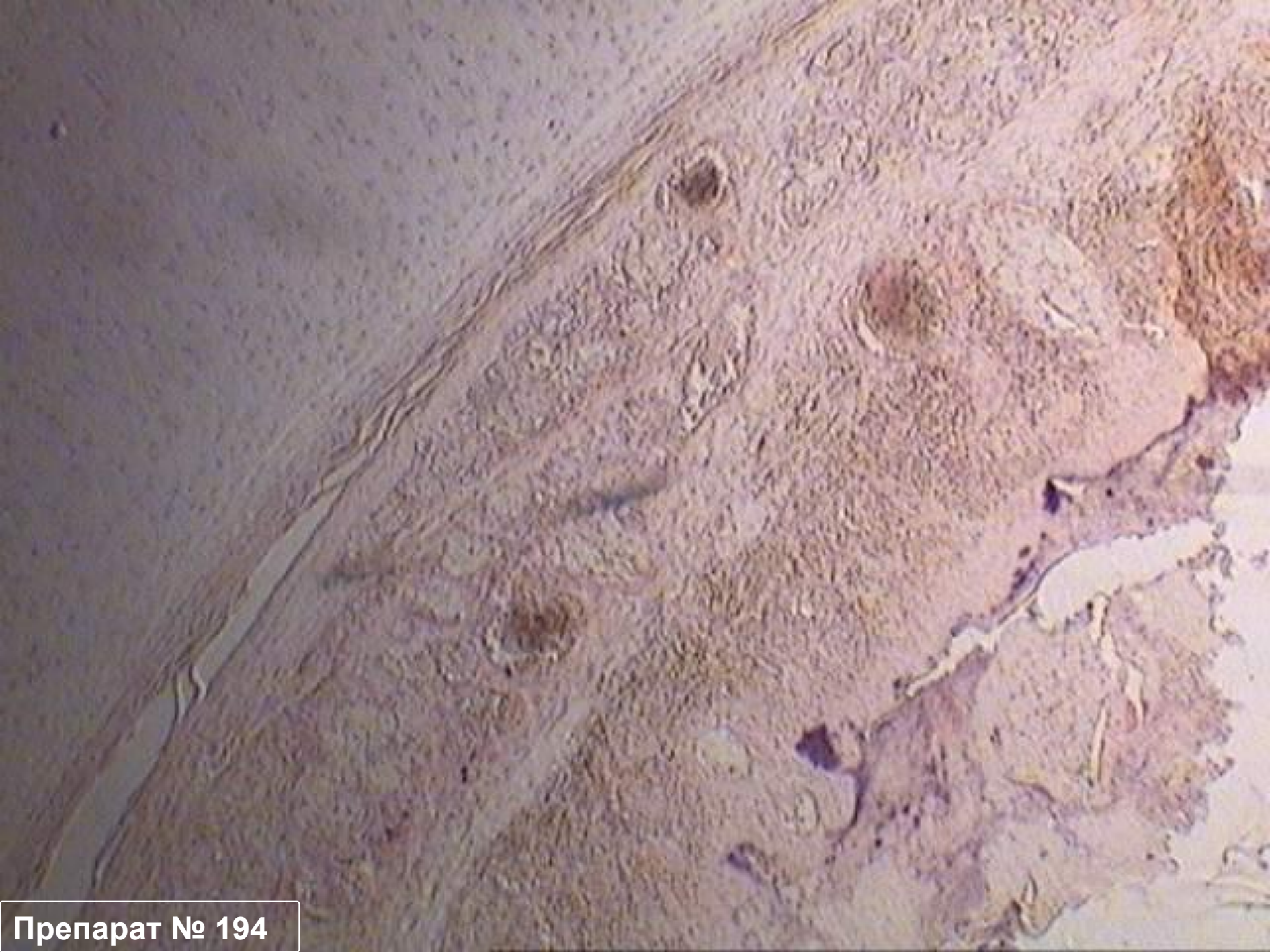
Препарат № 194