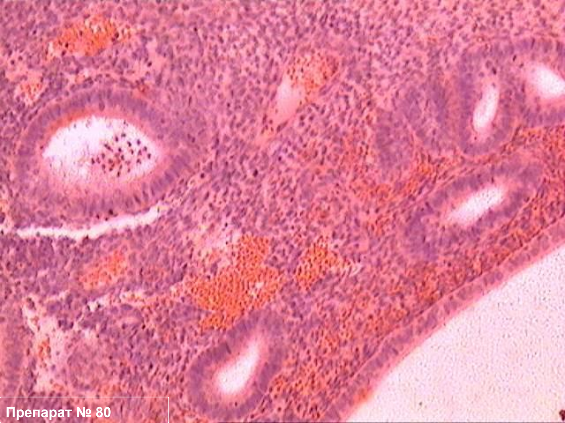
Препарат № 80