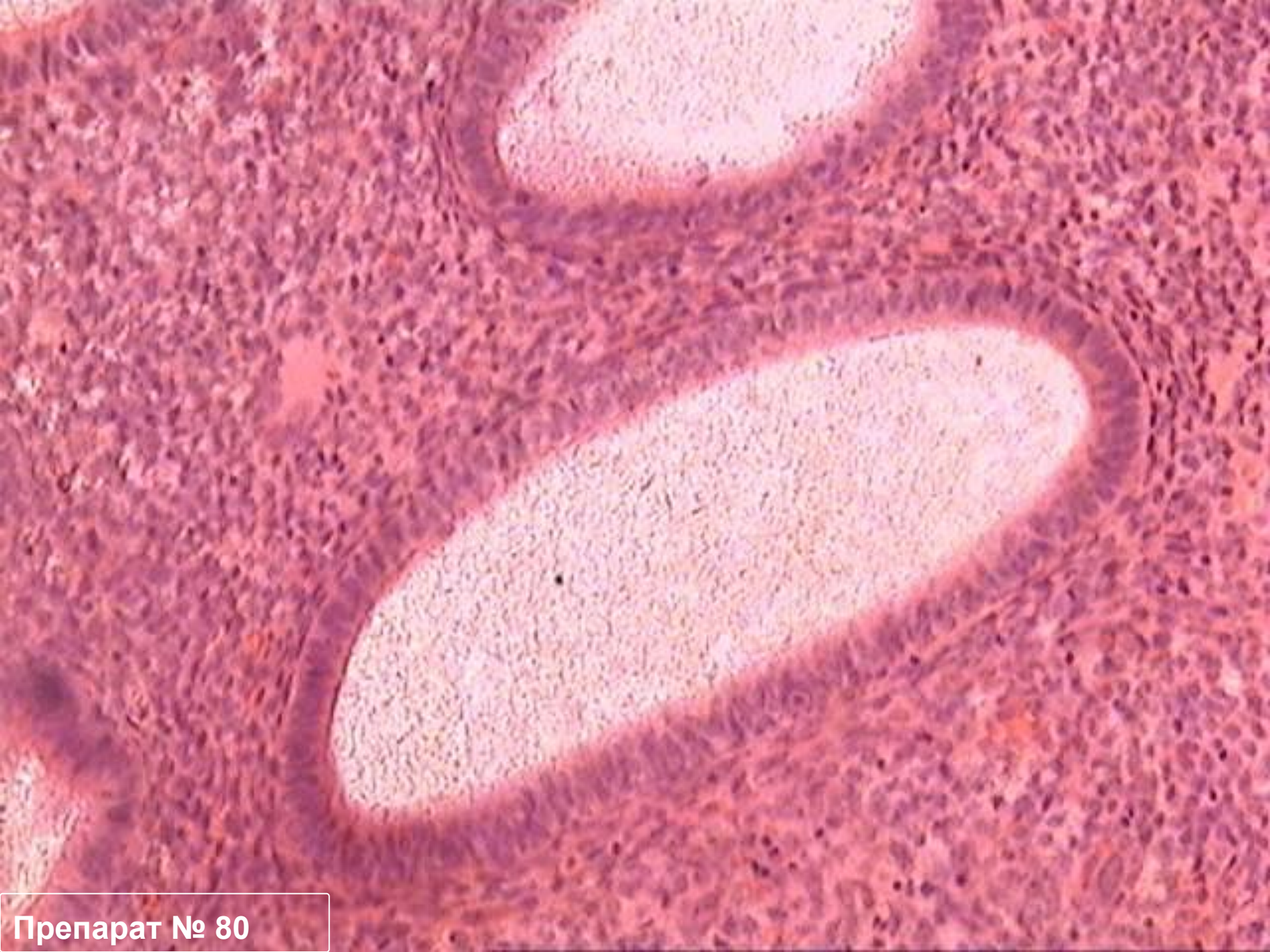
Препарат № 80