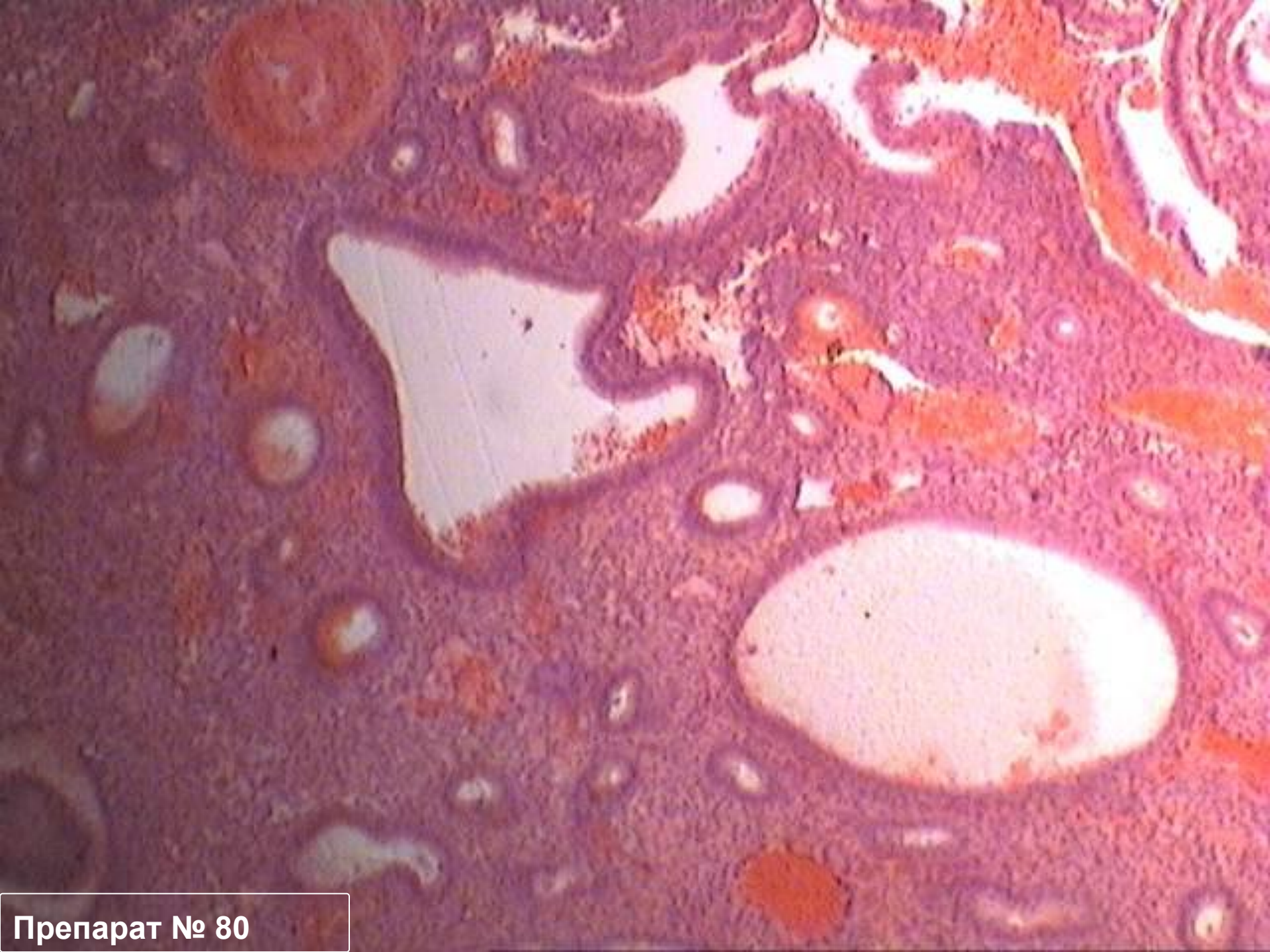
Препарат № 80