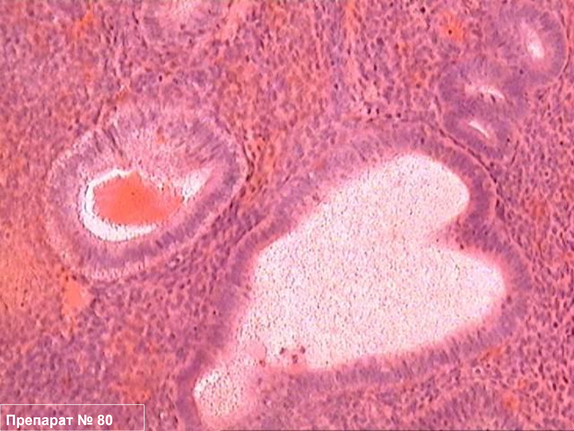
Препарат № 80