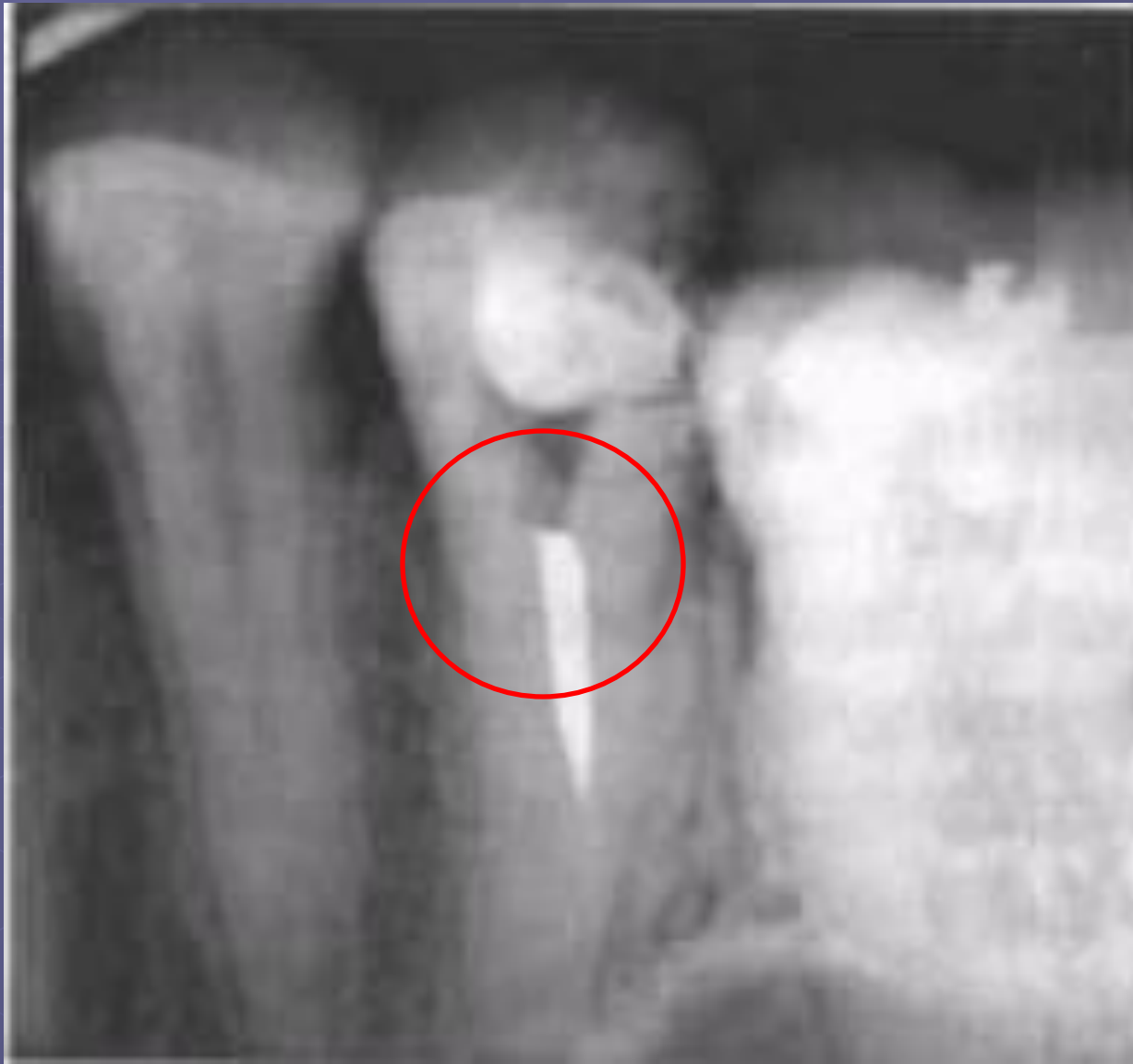
Некачественное пломбирование КК