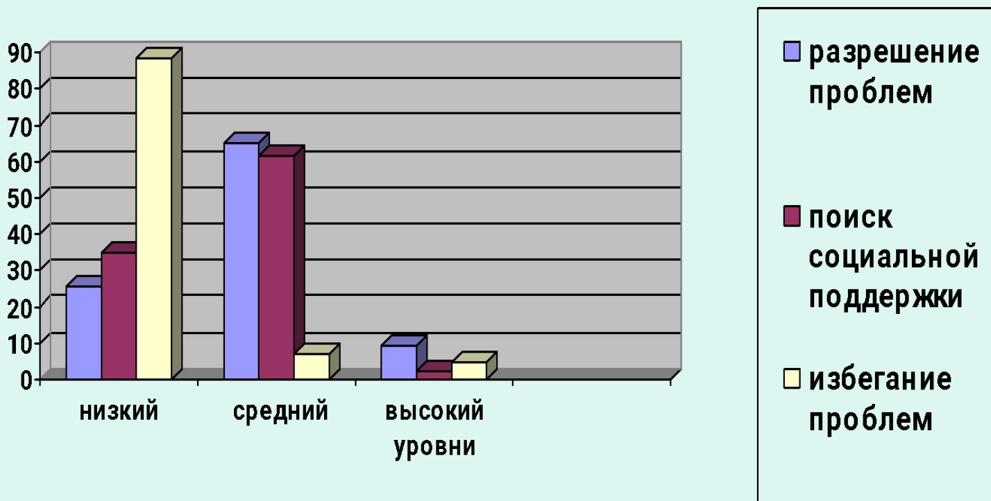
Рис.1. Распределение базисных копинг-стратегий подростков по разным уровням использования у подростков

Диагностика базисных стратегий преодолевающего поведения проводилась с помощью методики «Индикатор копинг-стратегий». Наиболее характерным является средний уровень стратегии «разрешения проблем» (65,1%) и низкий уровень стратегии «избегания проблем» (88,35%), т.е. у подростков преобладает поведение, которое отличается активностью, сознательностью, целенаправленностью. (рис.1)