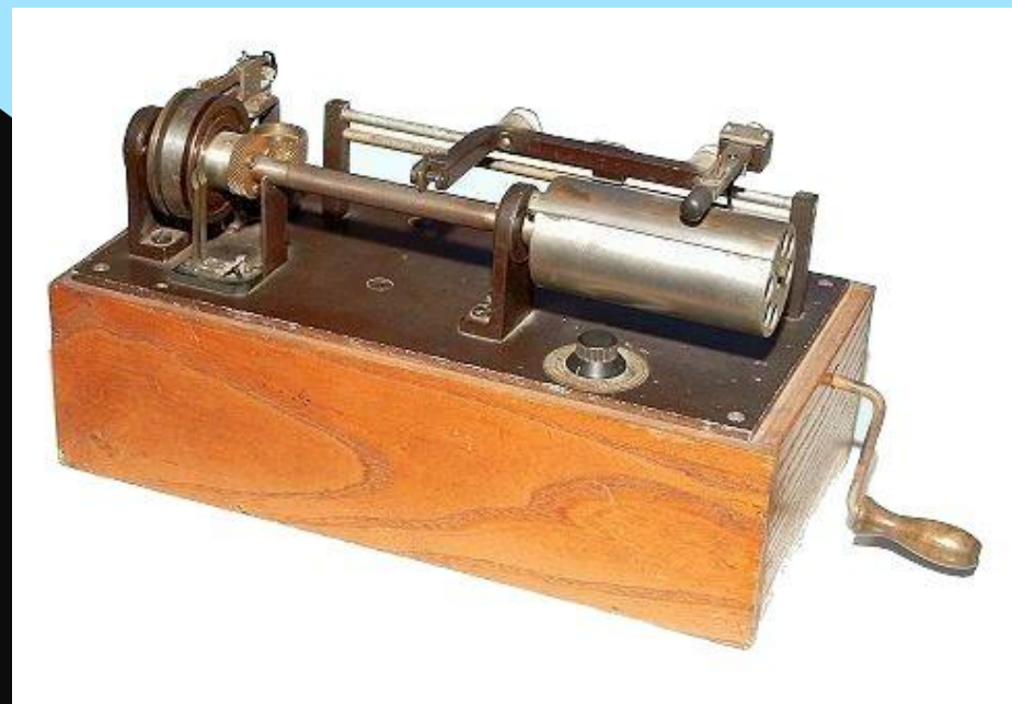
Факс Отто Фултона Fullograph 1844 года