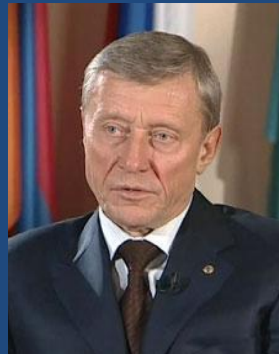
Генеральный секретарь Организации Договора о коллективной безопасности Николай Николаевич БОРДЮЖА

(из приоритетных направлений деятельности ОДКБ в 2013 году)