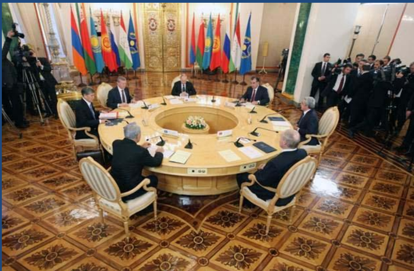
Сессия Совета коллективной безопасности ОДКБ (19 декабря 2012 года, г. Москва)

Основной формой деятельности Совета коллективной безопасности являются сессии, которые проводятся по мере необходимости, но не реже одного раза в год. Внеочередные сессии созываются по предложению не менее двух государств-членов. Существует практика проведения неформальных встреч президентов государств-членов ОДКБ для обсуждения отдельных важных вопросов.