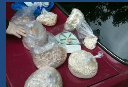
Образцы изъятых наркотиков: кокаин и синтетика