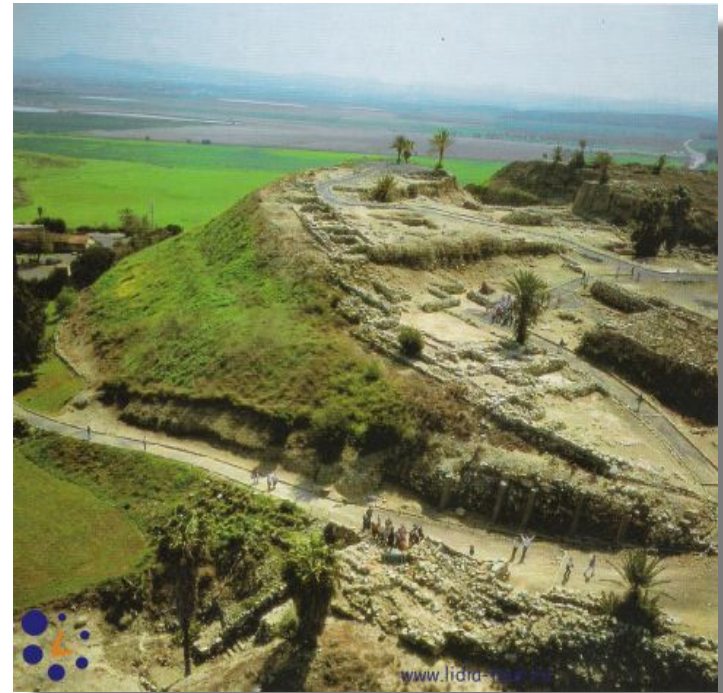
Мегиддо – археологический памятник. Израиль

основу этого направления деятельности составляет Гаагская конвенция 1954 года.