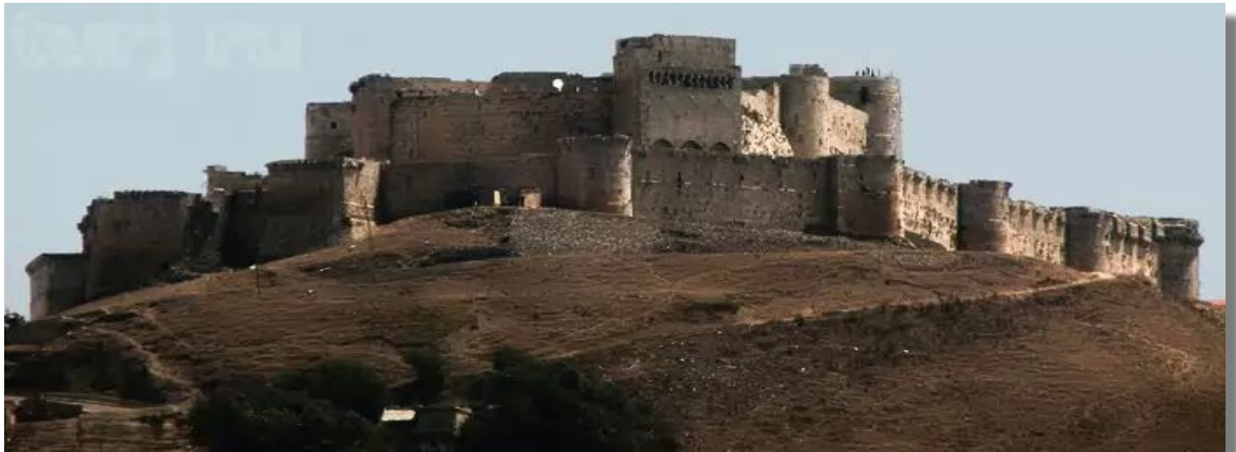
Крепость Крак- де- Шевалье.Сирия