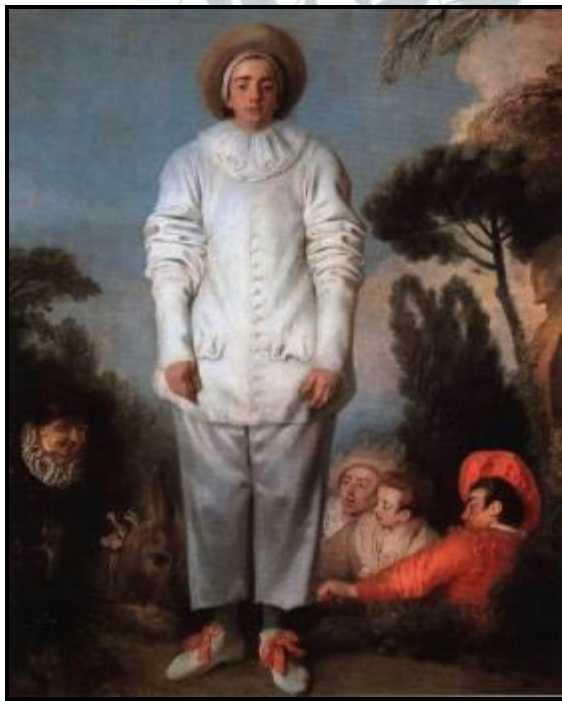
Антуан Ватто. Пьеро.