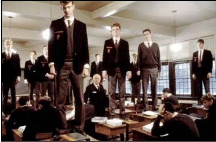
Кадр из фильма «Общество мёртвых поэтов»

Начало образовательного процесса задаёт актуализация вектора напряжения между каждым «Я» участников образовательного путешествия и предполагаемым предметом осмысления.