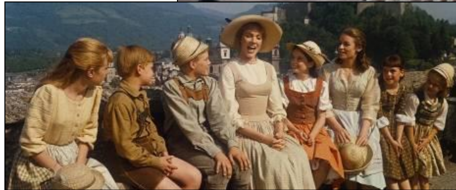
Кадры из фильма «Звуки музыки»