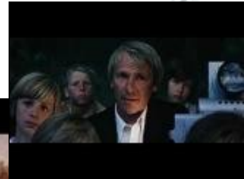
Кадры из фильма «Сто дней после детства»

Актуализация связей задаётся приглашением к диалогу в зоне наиболее вероятных точек соприкосновения участников путешествия и предмета осмысления.