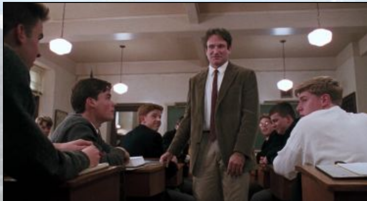
Кадры из фильма «Общество мёртвых поэтов»