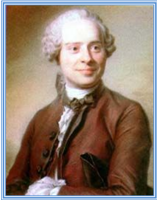
Жан Лерон Даламбер (1717 -1783)

Великий французский философ и математик Даламбер вошел в историю теории вероятностей со своей знаменитой ошибкой, суть которой в том, что он неверно определил равновозможность исходов в опыте всего с двумя монетами!