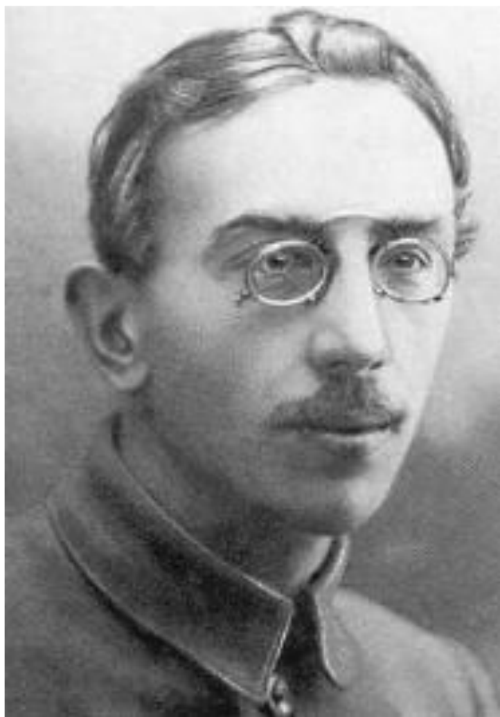
Н.Осинский- 1-й председатель ВСНХ

1 декабря 1917 г. ВЦИК образовал ВСНХ для управления и регулирования экономики страны. 14 декабря банковское дело было объявлено монополией государства. Частные банки и их средства были национализированы. В январе проводится национализация транспорта, в апреле - внешней торговли. РСФСР отказалась признать царские долги, отменила право наследования.