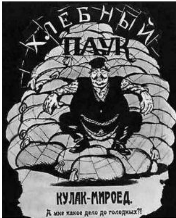
В.Дени. Хлебный паук.

В начале для получения продовольствия правительство использовало товарообмен, но в условиях развала экономики промышленных товаров не хватало и крестьяне не спешили отдавать хлеб государству в обмен на реквизиционные чеки. Над страной нависла угроза голода. В столицах выдавали по 50-100 г хлеба в сутки на человека. 13 мая ВЦИК установил душевые нормы потребления хлеба для крестьян. Весь хлеб сверх установленной нормы подлежал конфискации.