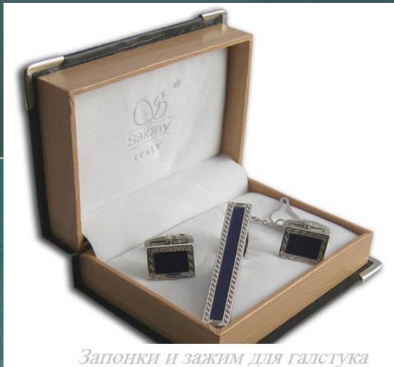
Запонки и зажим для галстука