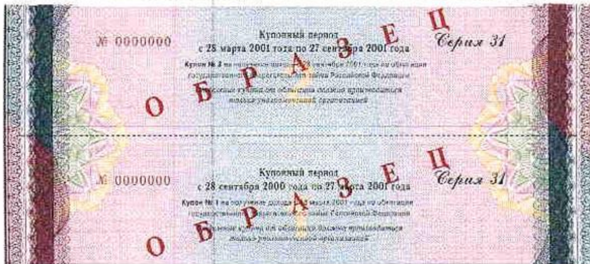
Пример облигации России (2001 г.)