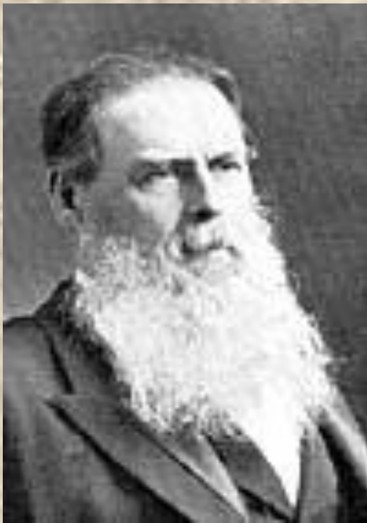
Эдуард Тейлор (1832—1917).

В научном мире понятие, категорию и термин "культура" анализируют более детально и пытаются найти наиболее верное определение.