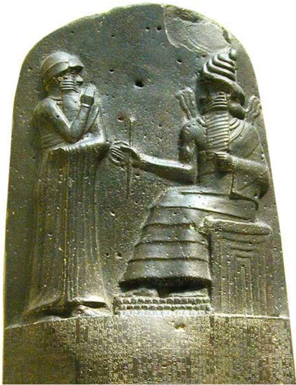
Стелла законов Хаммурапи