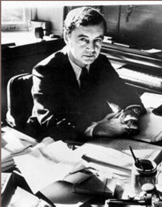
Эрвинг Гоффман Erving Goffman (1922- 1982)