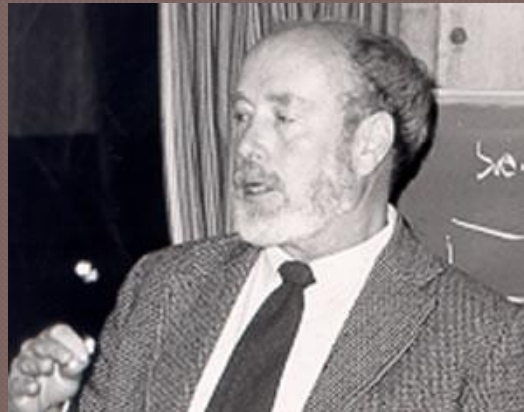
Томас Лукман Thomas Luckmann (1927)

Социальное конструирование реальности (1966)