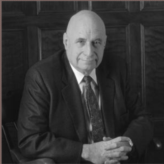
Питер Бергер Peter C. Berger (1929)

Социальное конструирование реальности (1966)