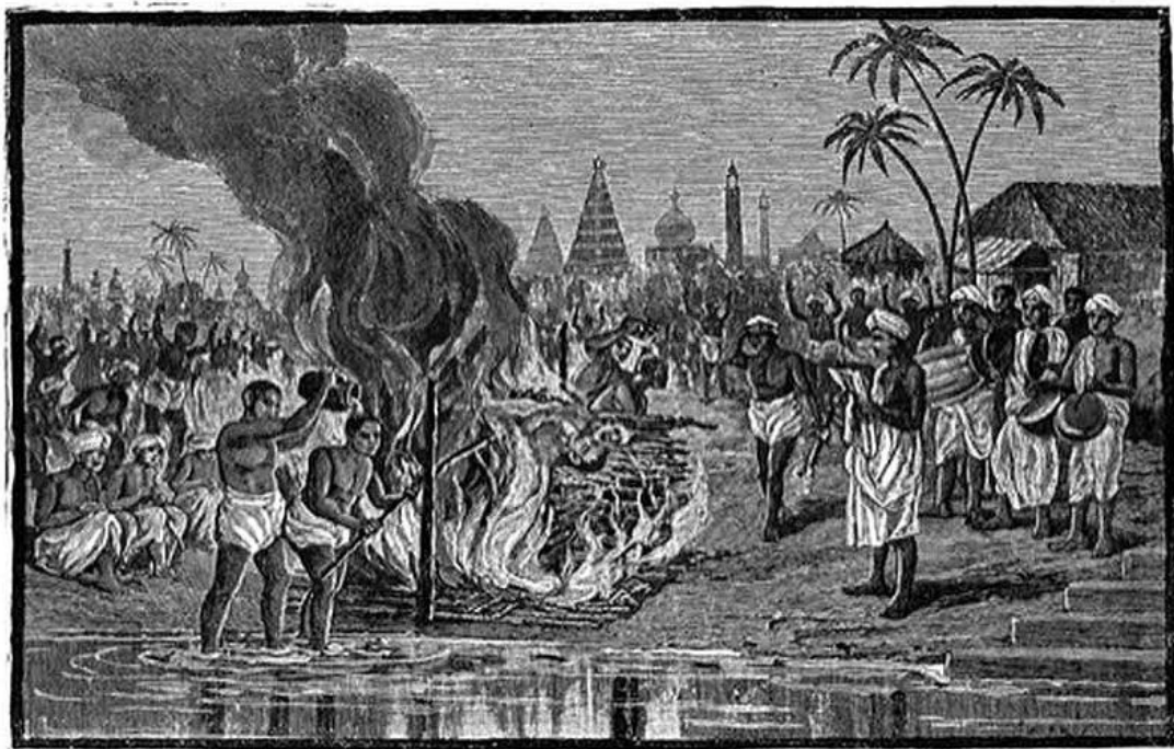
A HINDU SUTTEE.