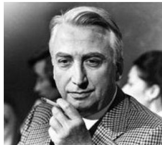
Ролан Барт Roland Barthes (1915-1980)