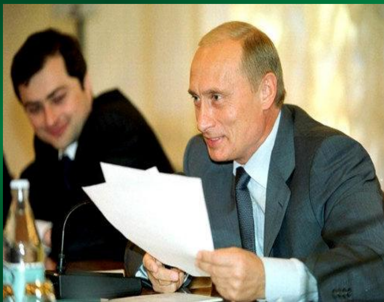
Президент РФ В.В.Путин

Политика максимальной открытости деятельности государственных учреждений и свобода информации.