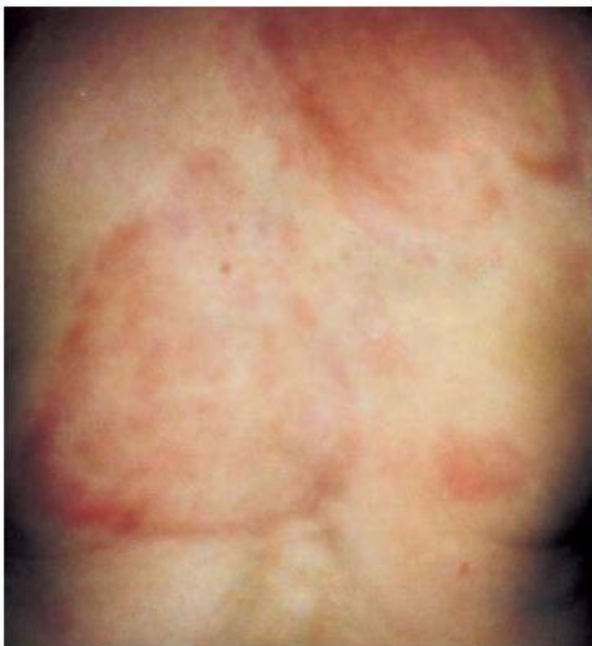
Клинические проявления лекарственной болезни по типу крапивницы