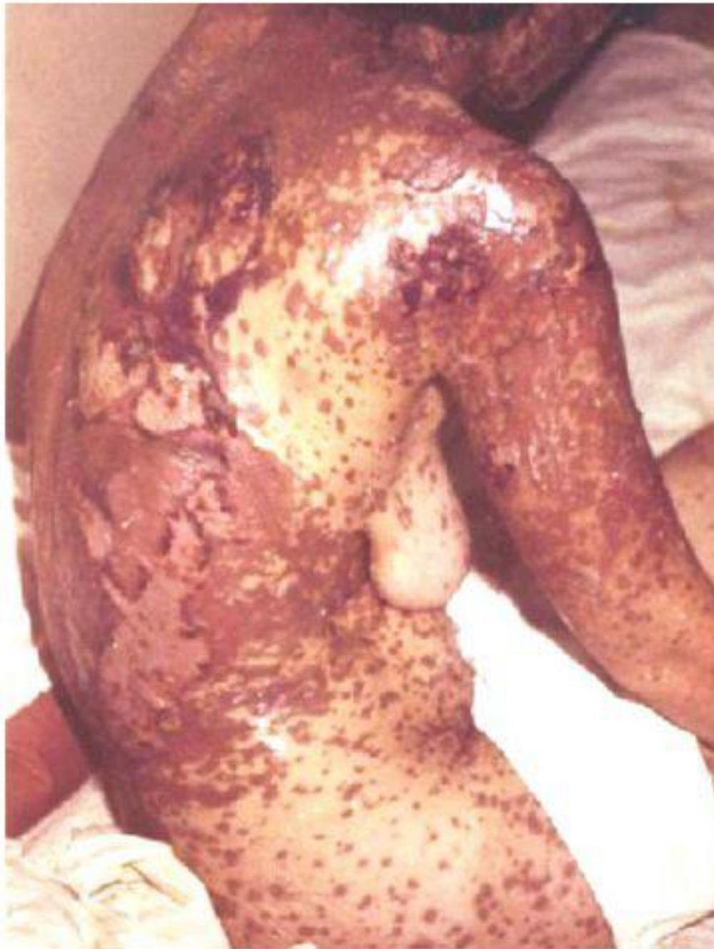
Клинические проявления лекарственной болезни по типу синдрома Лайелла