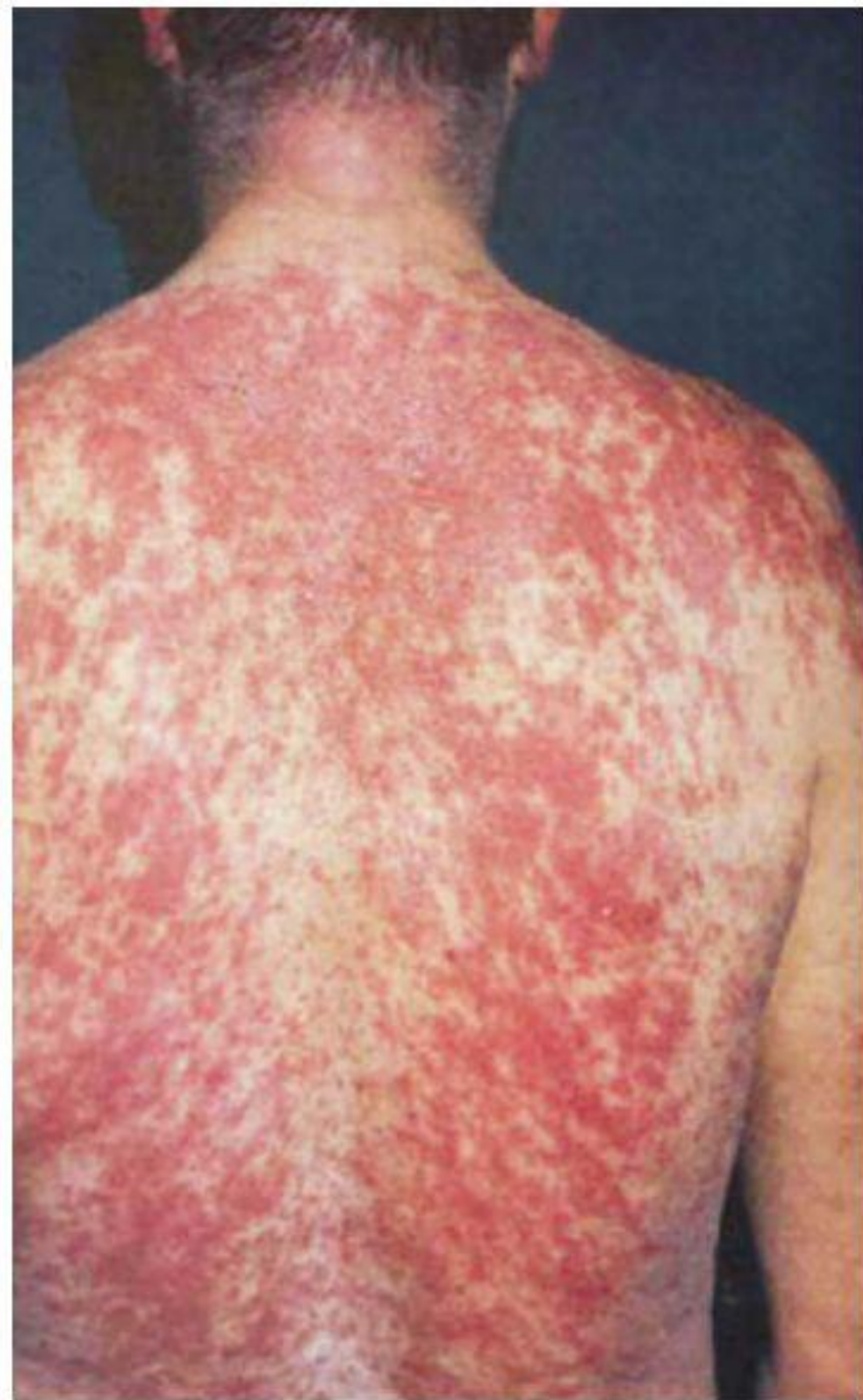
Клинические проявления токсико-аллергической реакции