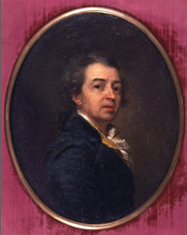
Д. Г. Левицкий. Автопортрет. 1780-е гг. Челябинская картинная галерея.