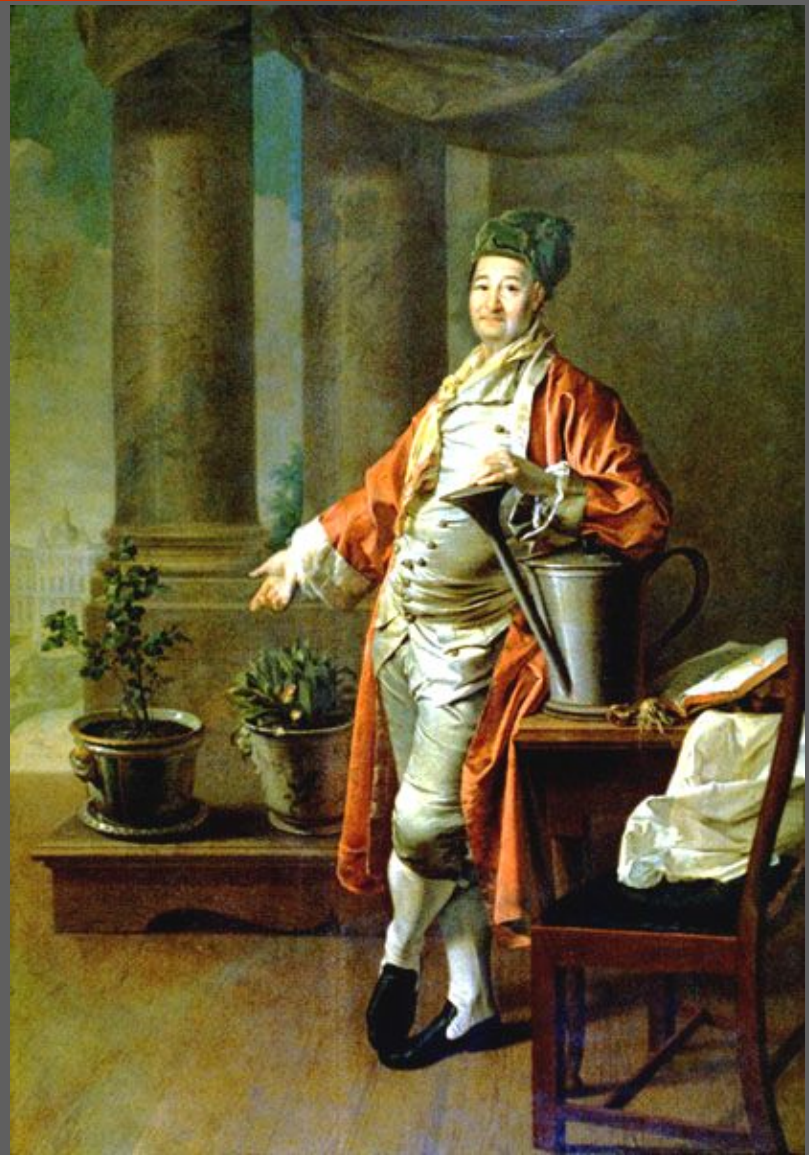
Д. Г. Левицкий. Портрет П.А. Демидова. 1773. Холст, масло, Государственная Третьяковская галерея, Москва.