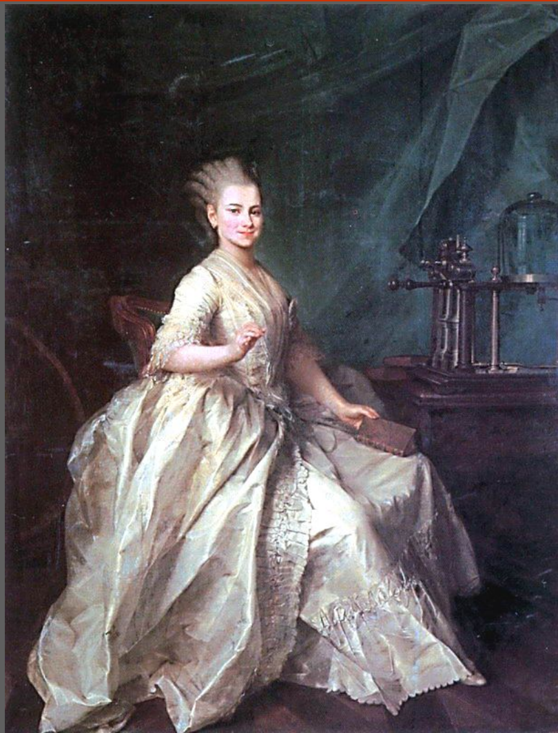
Д.Г. Левицкий. Портрет Е.Н. Молчановой. 1776. Холст, масло. Русский музей, С.-Петербург.