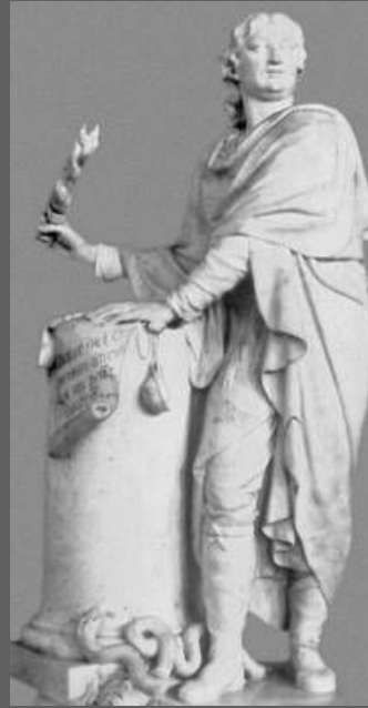
М.И. Козловский. Яков Долгорукий, разрывающий царский указ. Мрамор. 1797. Русский музей. С.-Петербург.