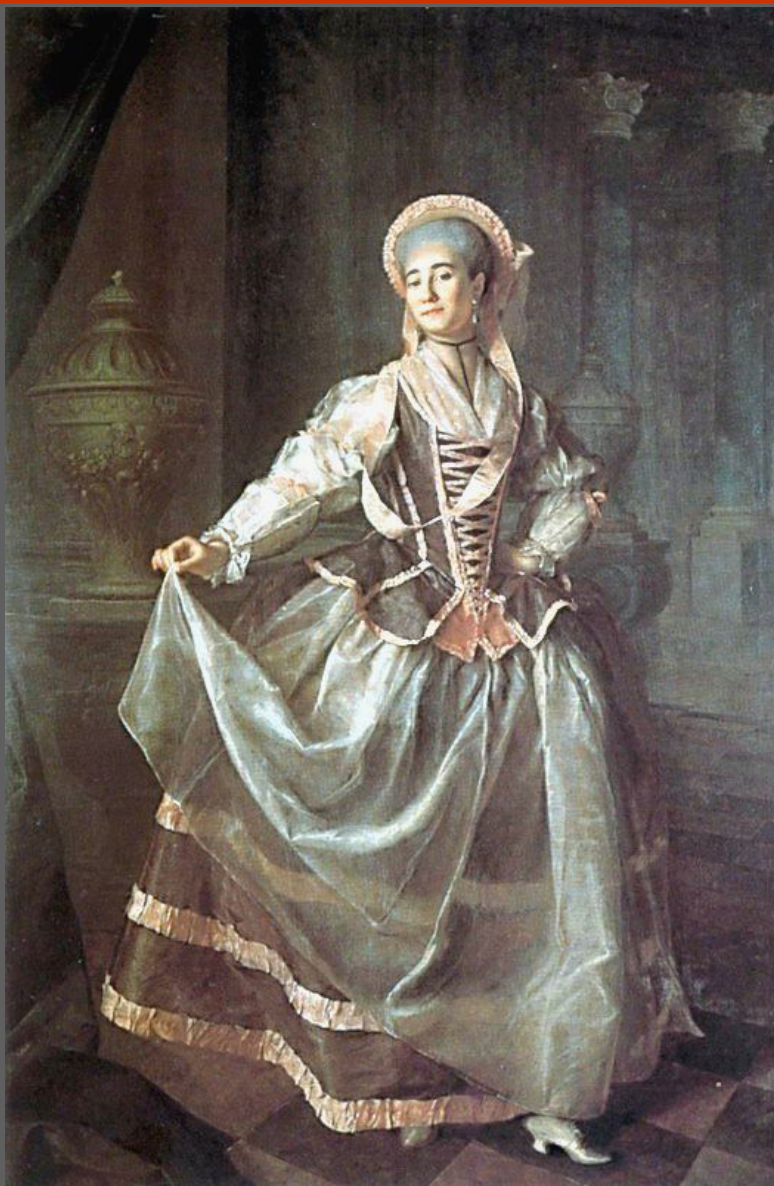
Д.Г. Левицкий. Портрет А.П. Левшиной. Холст, масло. ГРМ, С.-Петербург.