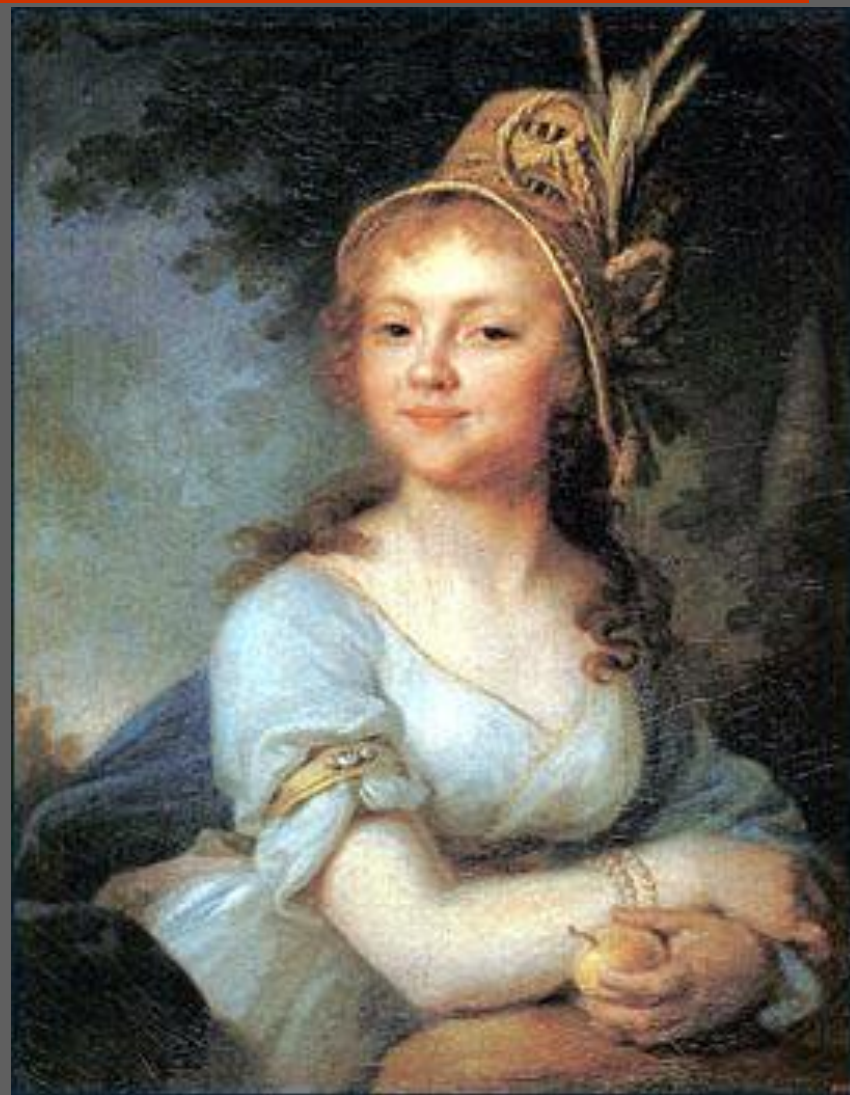
В.Л. Боровиковский. Портрет Е.Н. Арсеньевой, 1796. ГРМ, С.-Петербург.