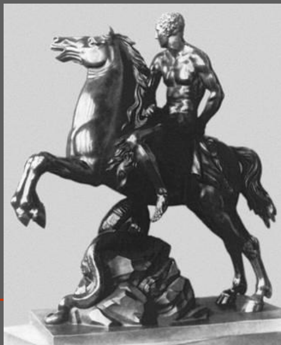
М.И. Козловский. Геркулес на коне. Бронза. 1799. Русский музей. С.-Петербург.