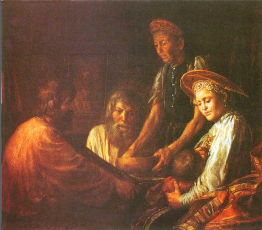
М. Шибанов. Крестьянский обед. Холст, масло. 1774. ГТГ, Москва.