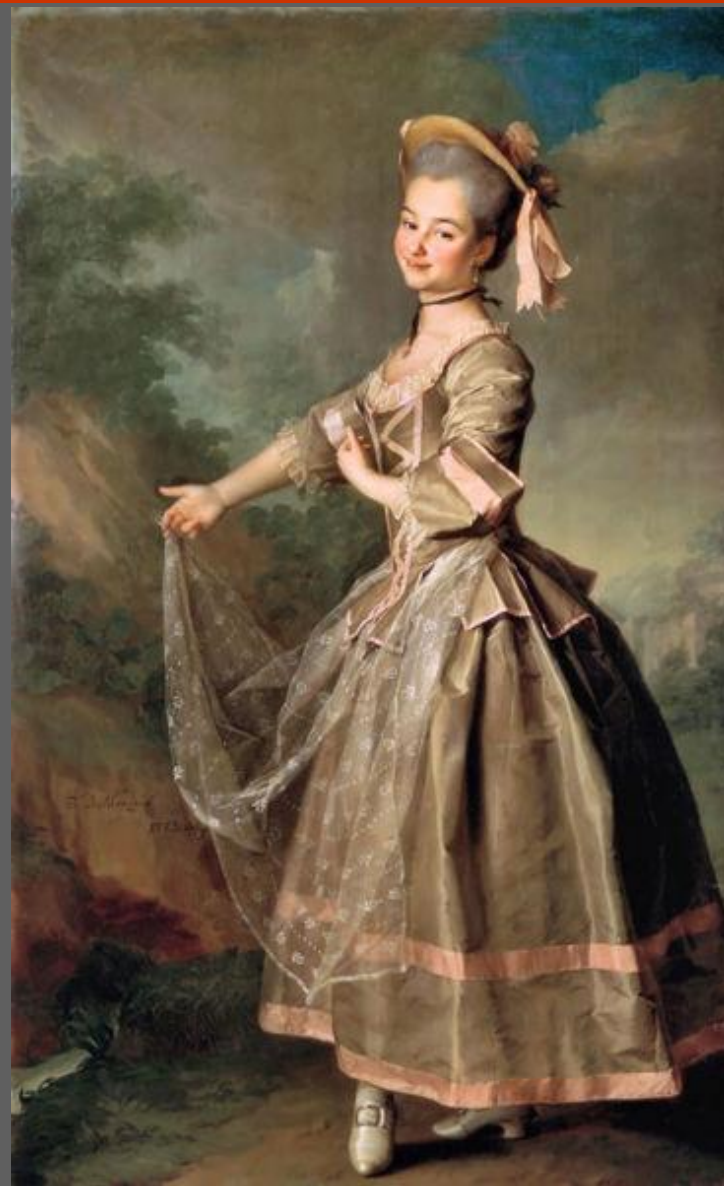
Д.Г. Левицкий. Портрет Е.И. Нелидовой. 1773. Холст, масло. ГРМ, С.-Петербург.