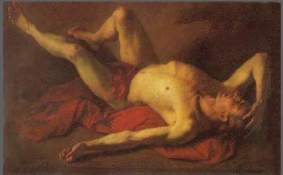
А. П. Лосенко. Авель. 1768. Харьковский художественный музей.