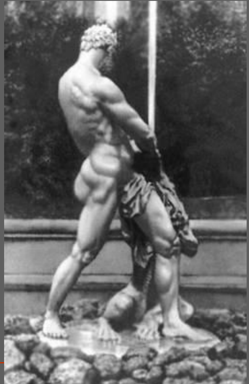
М.И. Козловский. Самсон, раздирающий пасть льва. Золочёная бронза. 1800—02. Петродворец. Большой каскад. Утрачена, воссоздана в 1947 г. В.Л. Симоновым).