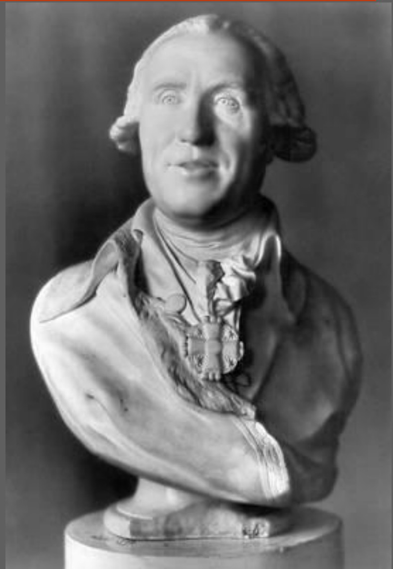
Ф.И. Шубин. Портрет Е.М. Чулкова. Мрамор. 1792. Русский музей. С.-Петербург.