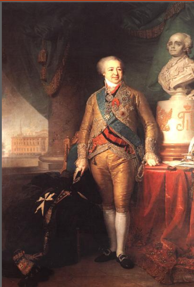
В.Л. Боровиковский. Портрет князя А.Б. Куракина. 1801—1802. ГТГ