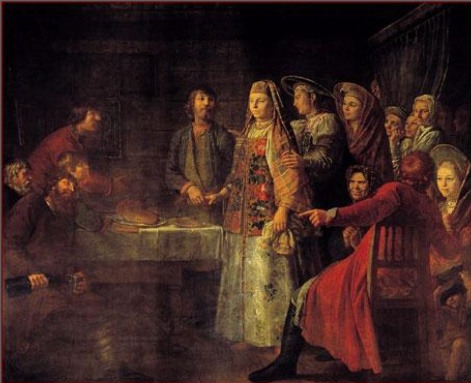
М. Шибанов. Празднество свадебного договора или сговор. 1777. ГТГ, Москва.