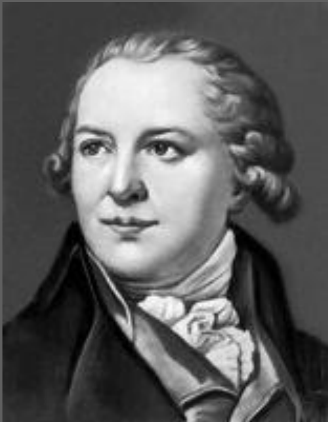
Ф. И. Шубин. Автопортрет. Русский музей. С.-Петербург.