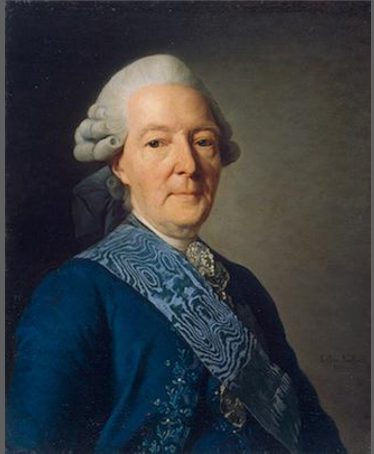
А. Рослин. Портрет И. Бецкого. 1777.