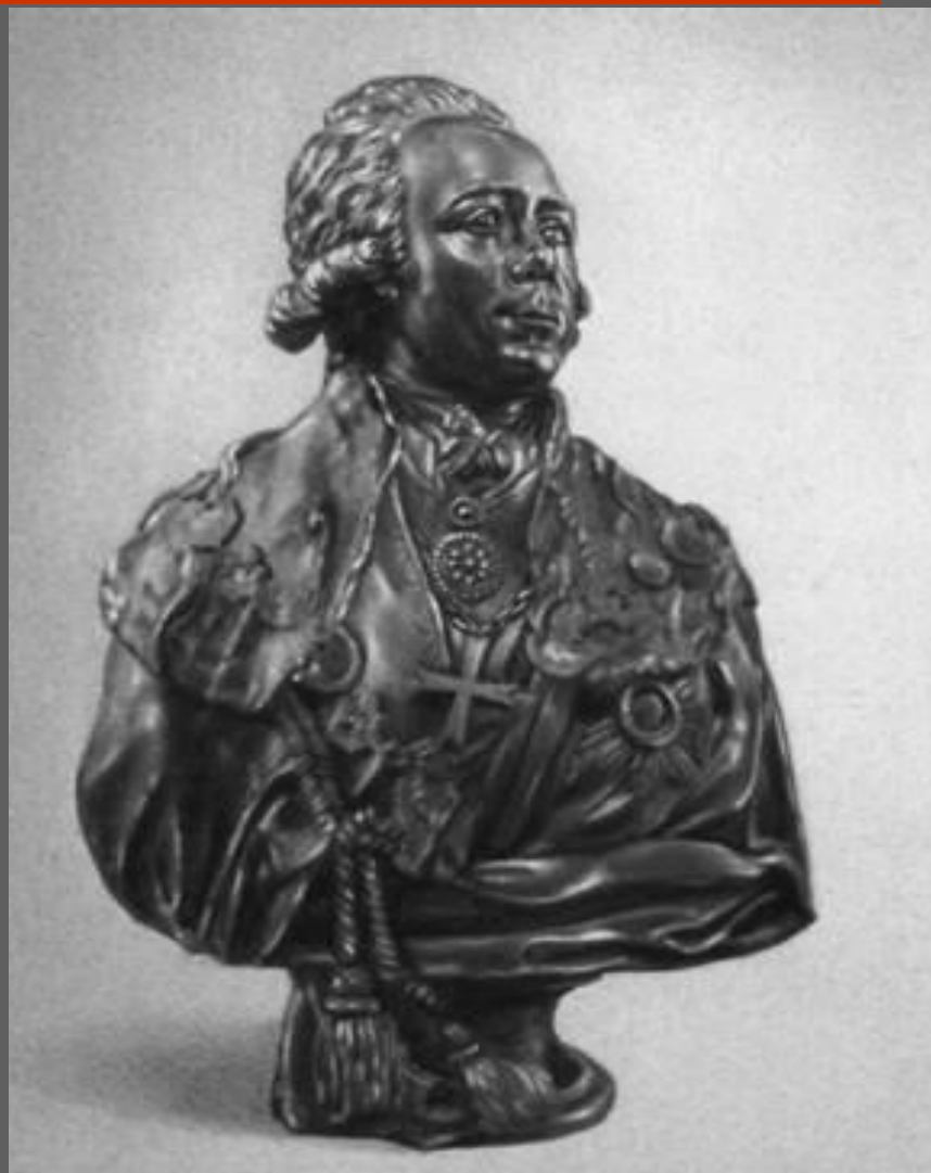
Ф.И. Шубин. Портрет Павла I. Бронза. 1800. ГТГ. Москва.