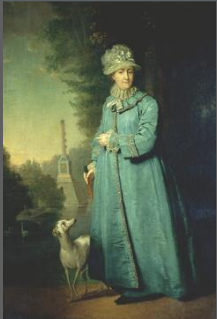
В. Боровиковский. Екатерина II на прогулке в Царскосельском парке (с Чесменской колонной на фоне). 1794. ГТГ. Москва.