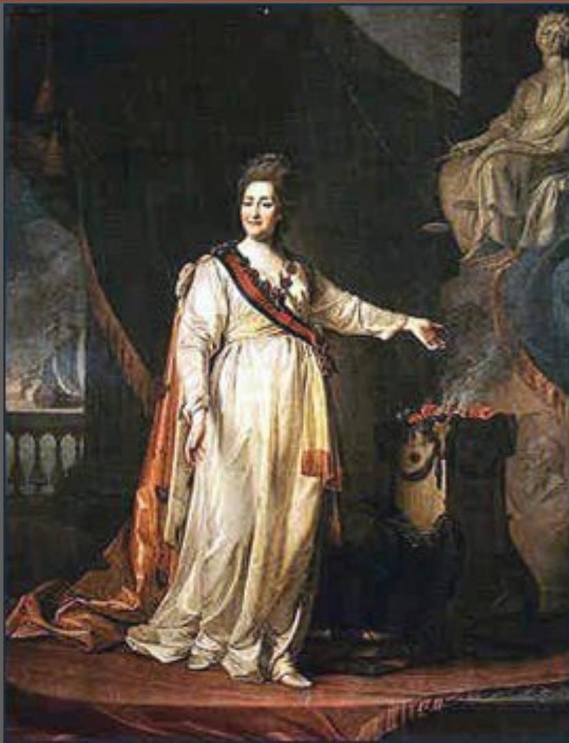
Д. Г. Левицкий. Портрет Екатерины II — законодательницы в храме богини Правосудия. 1783. Холст, масло. Государственный Русский музей, С.-Петербург.