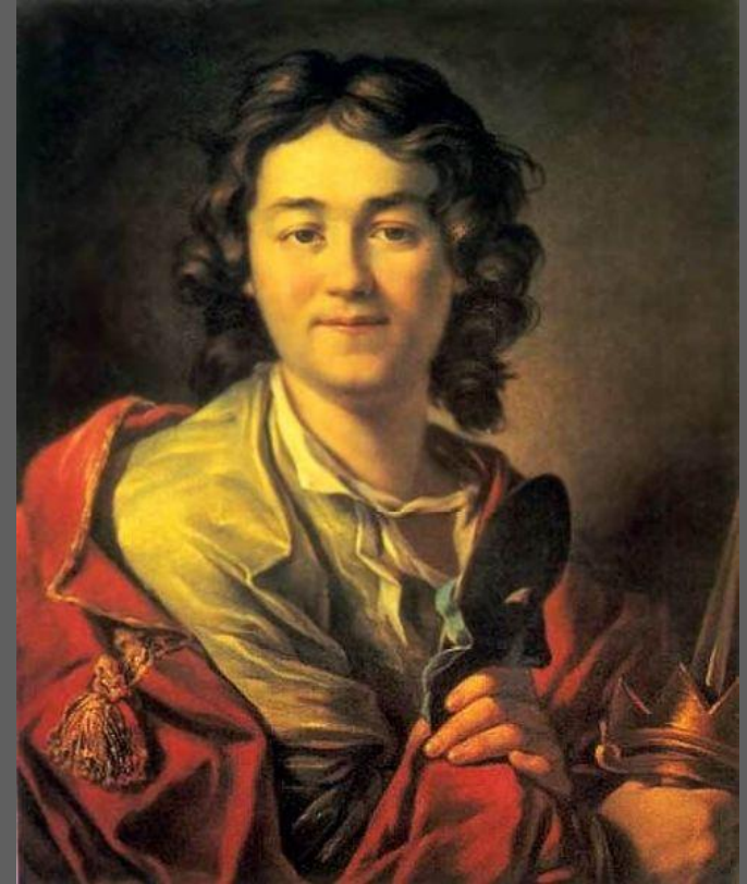
А. П. Лосенко. Портрет актера Ф. Волкова. 1763, ГТГ, Москва.