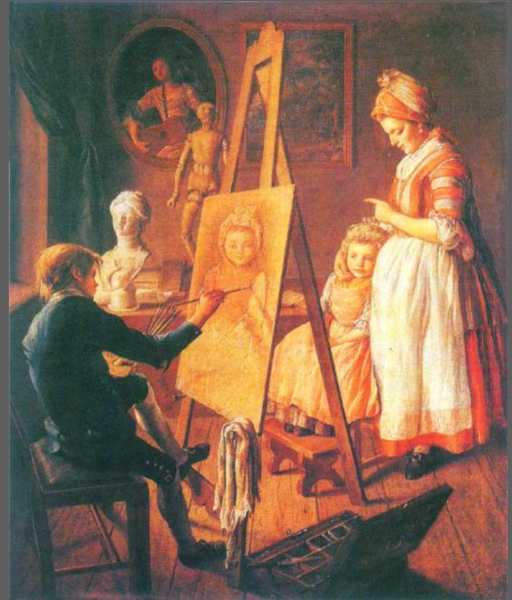
И. Фирсов. Юный живописец. 1765 — 1766 (?), холст, масло. ГТГ, Москва.