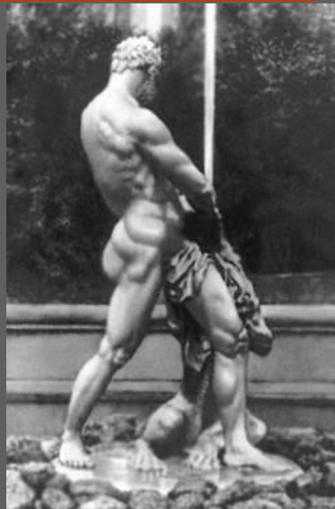
М.И. Козловский. Самсон, раздирающий пасть льва. Золочёная бронза. 1800—02. Петродворец. Воссоздана в 1947 г. В.Л. Симоновым).