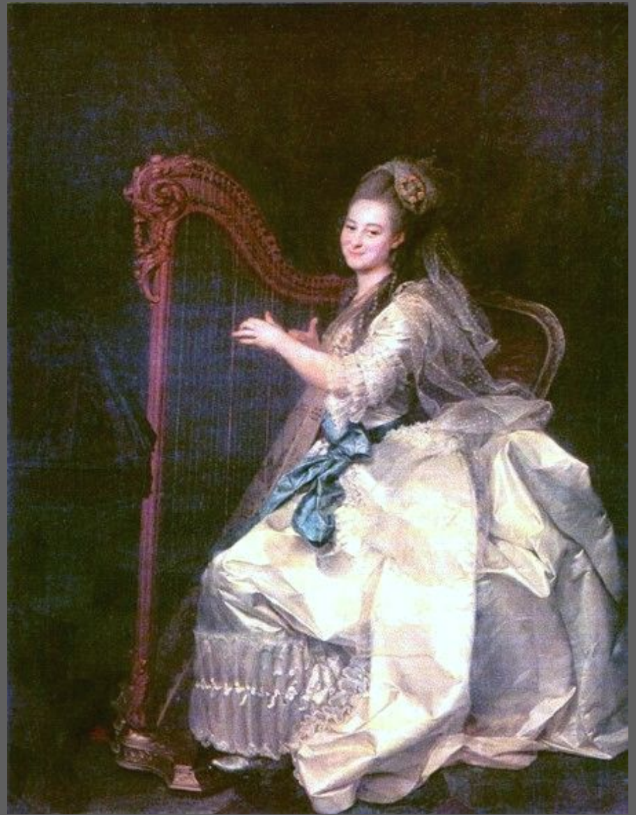
Д.Г. Левицкий. Портрет Г.И. Алымовой. 1776. Холст, масло. ГРМ, С.-Петербург.