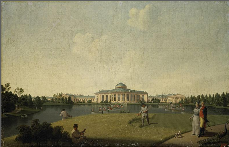
Б. Патерсен. Вид Таврического дворца со стороны сада.