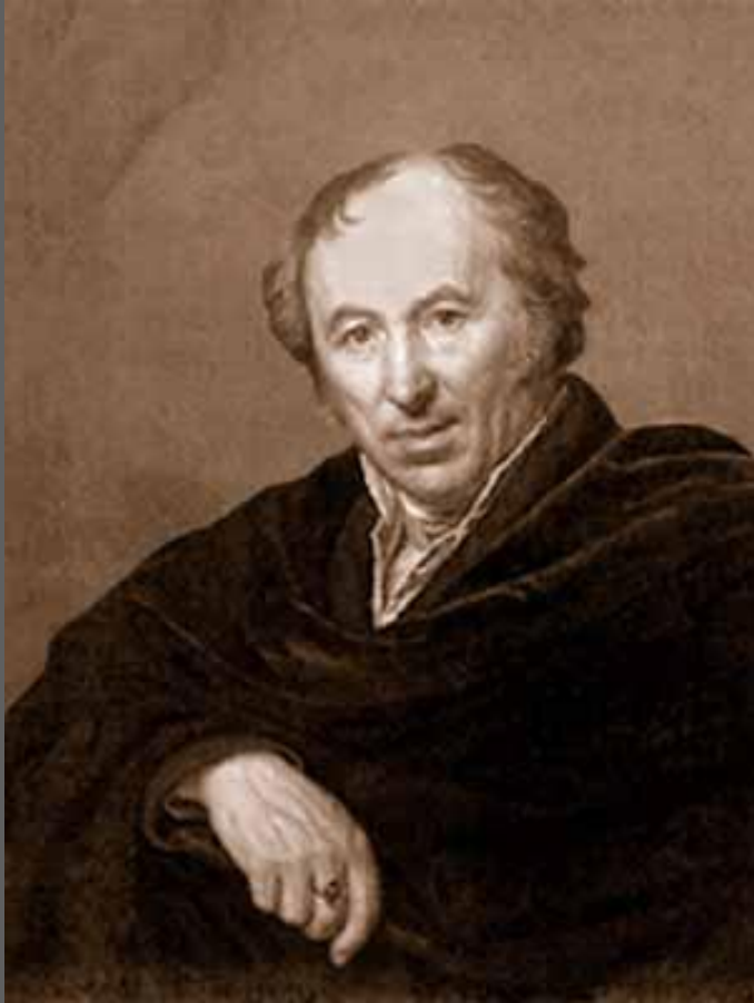
И. П. Мартос.