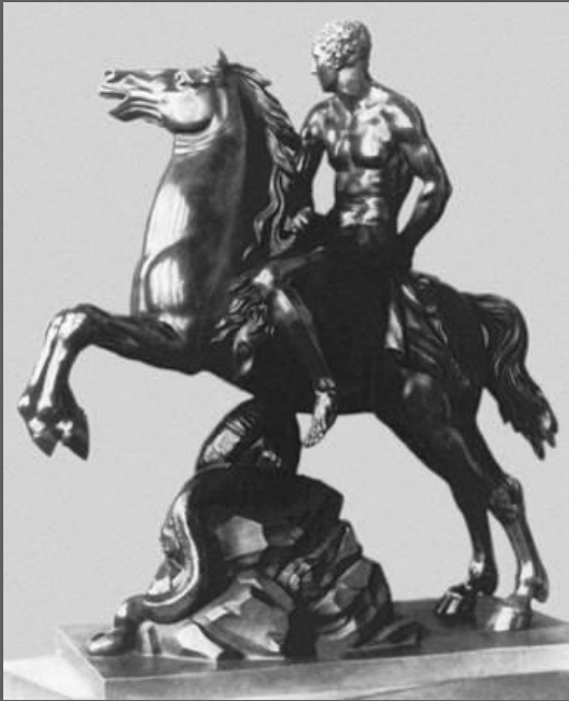
М.И. Козловский. Геркулес на коне. Бронза. 1799. Русский музей. С.-Петербург.