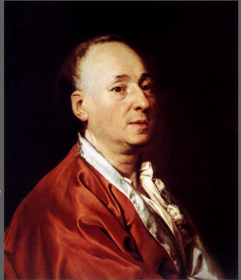
Д. Г. Левицкий. Портрет Дени Дидро. 1773—1774 гг. Холст, масло. Музей искусства и истории. Женева.