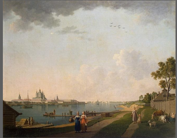
Б. Патерсен. Вид Смольного монастыря со стороны Охты.