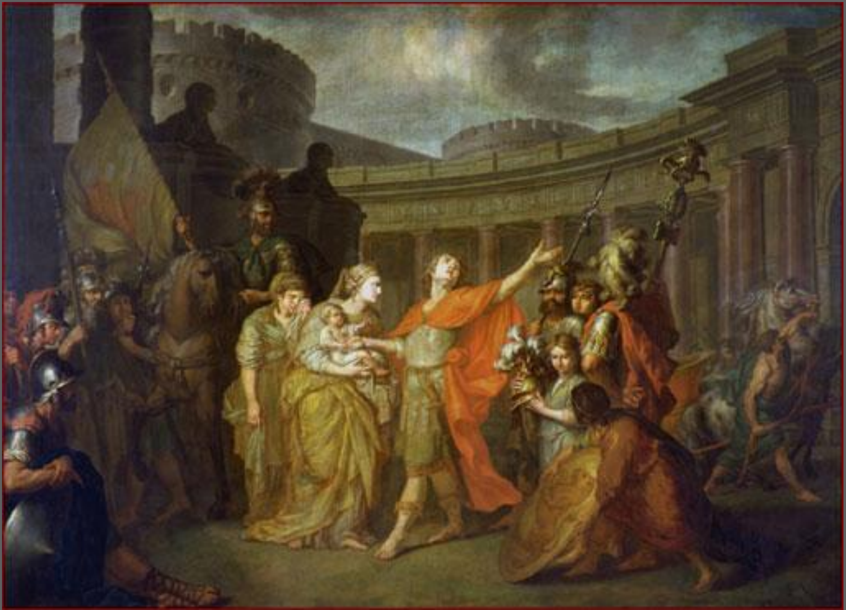
А. П. Лосенко. Прощание Гектора с Андромахой. 1773. ГТГ, Москва.