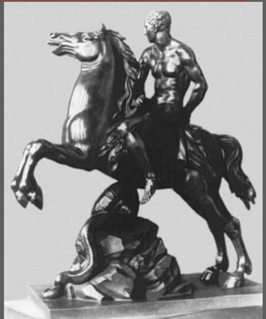
М. И. Козловский. «Геркулес на коне». Бронза. 1799. Русский музей. С.-Петербург.