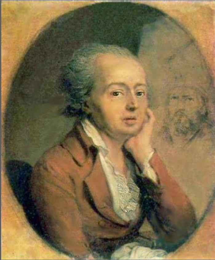
Д. Г. Левицкий. Портрет В. Л. Боровиковского.