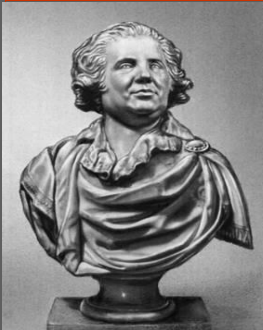
Ф.И. Шубин. Портрет А.А. Безбородко. 1798. Мрамор. ГРМ. С.-Петербург.