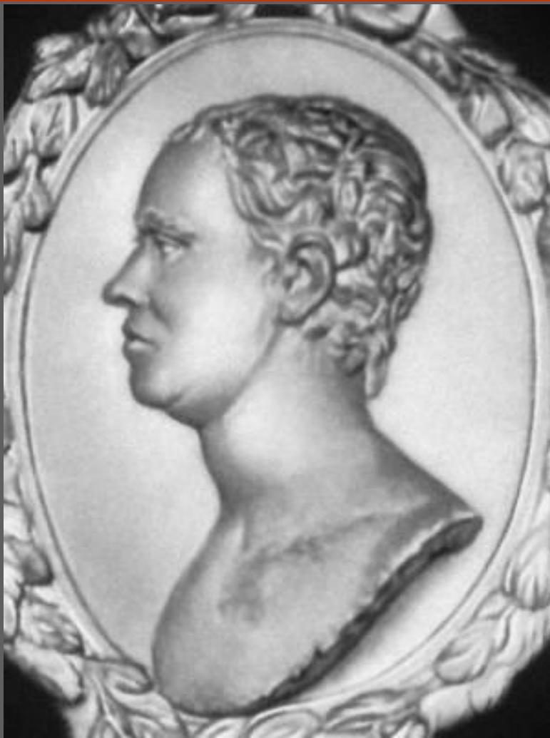
М. И. Козловский. Скульптурный портрет работы В. И. Демут-Малиновского. Мрамор. 1802. Русский музей. С.-Петербург..