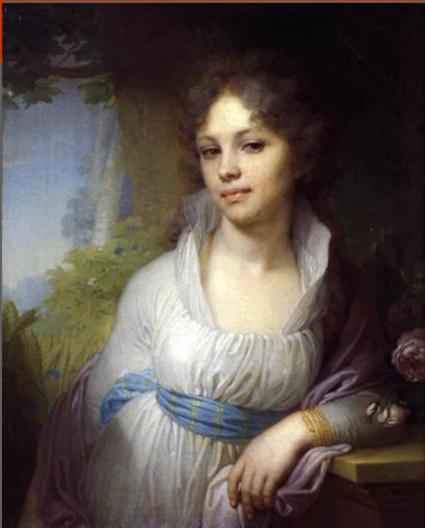
В. Боровиковский. Портрет М. И. Лопухиной. 1797. ГТГ. Москва.