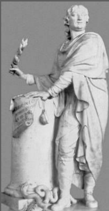
М.И. Козловский. Яков Долгорукий, разрывающий царский указ. Мрамор. 1797. Русский музей. С.-Петербург.