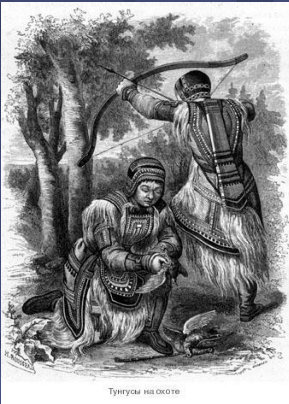
Тунгусы на охоте