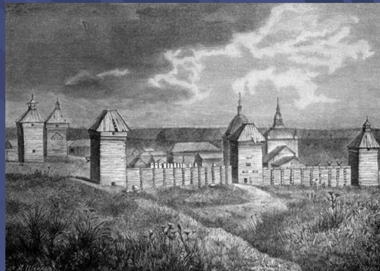
Вид развалин Якутского острога