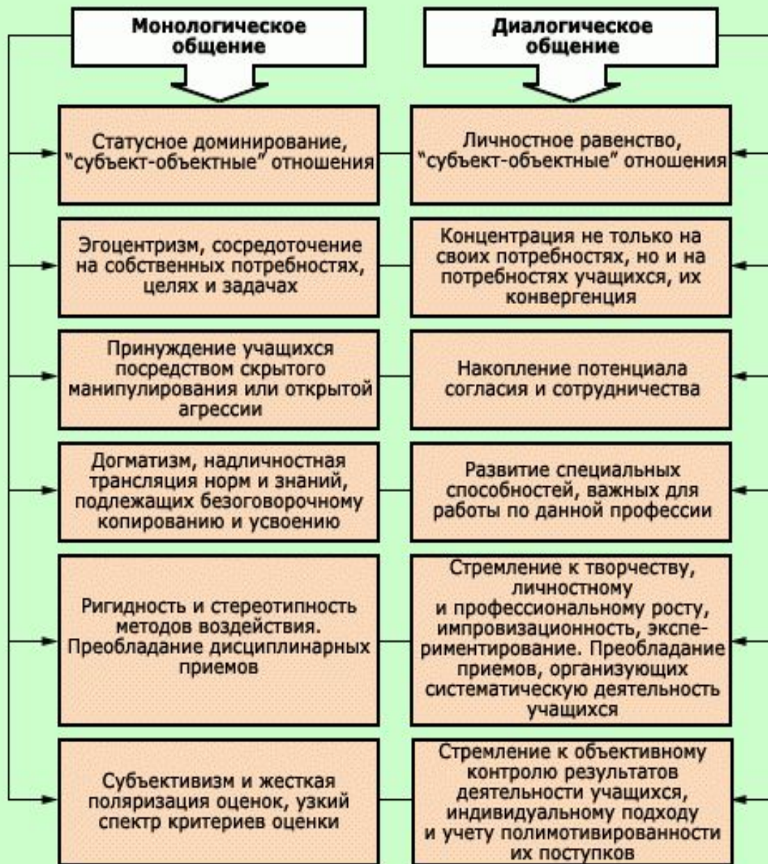
Рис. 8. Сравнительный анализ монологического и диалогического стилей педагогического общения