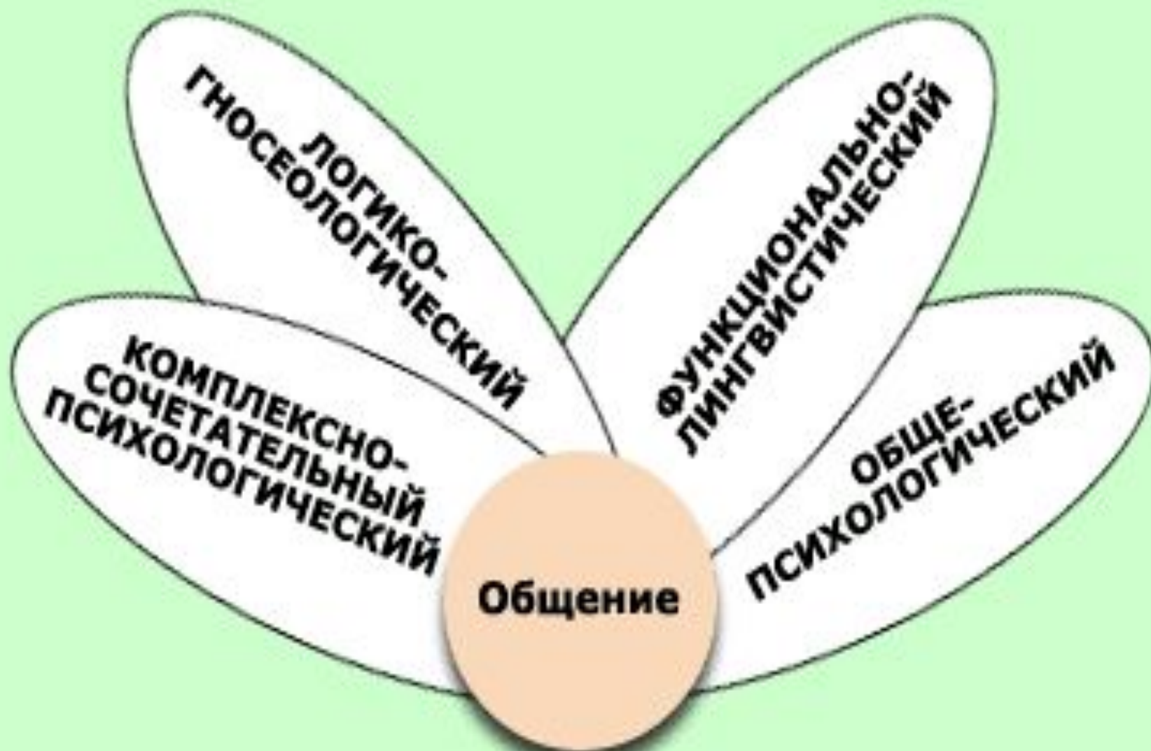
Рис. 2. Междисциплинарный подход к общению