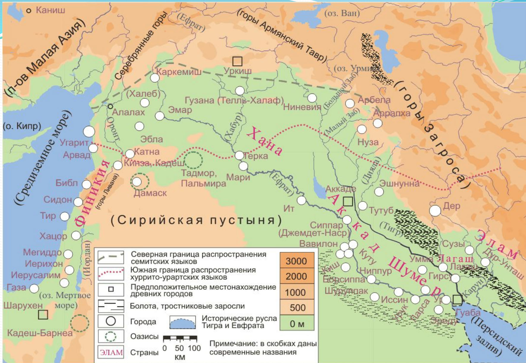
Map created for Gumilevica - A.Rodionov