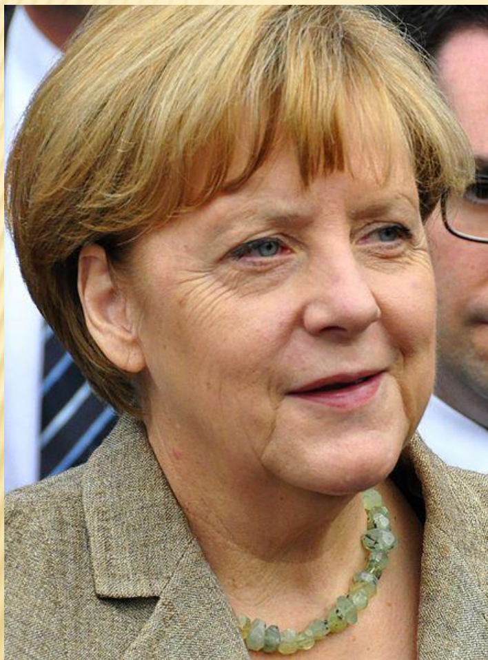
Федеральный канцлер ФРГ – глава правительства ФРГ. Должность с 21 ноября 2005 года занимает – Ангела Меркель