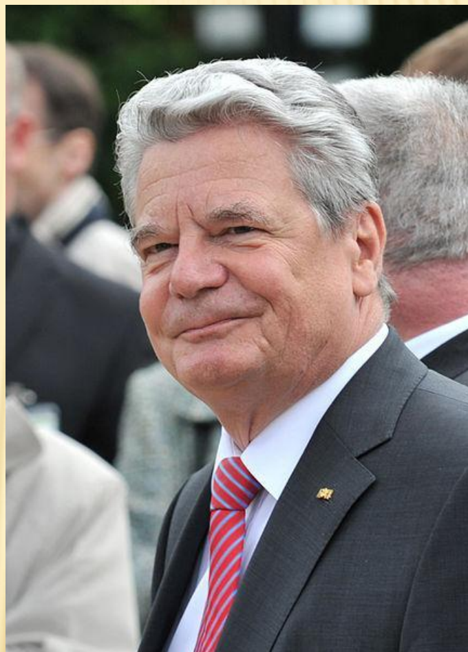
Федеральный президент Германии - глава государства в ФРГ. Должность с 18 марта 2012 занимает Йоахим Гаук.