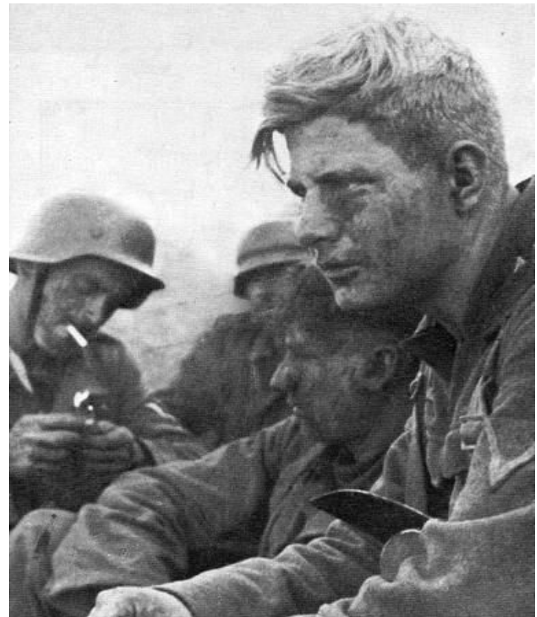
Улица Артёма. Сентябрь 1943 года и лица солдат 29-го армейского корпуса после боя.