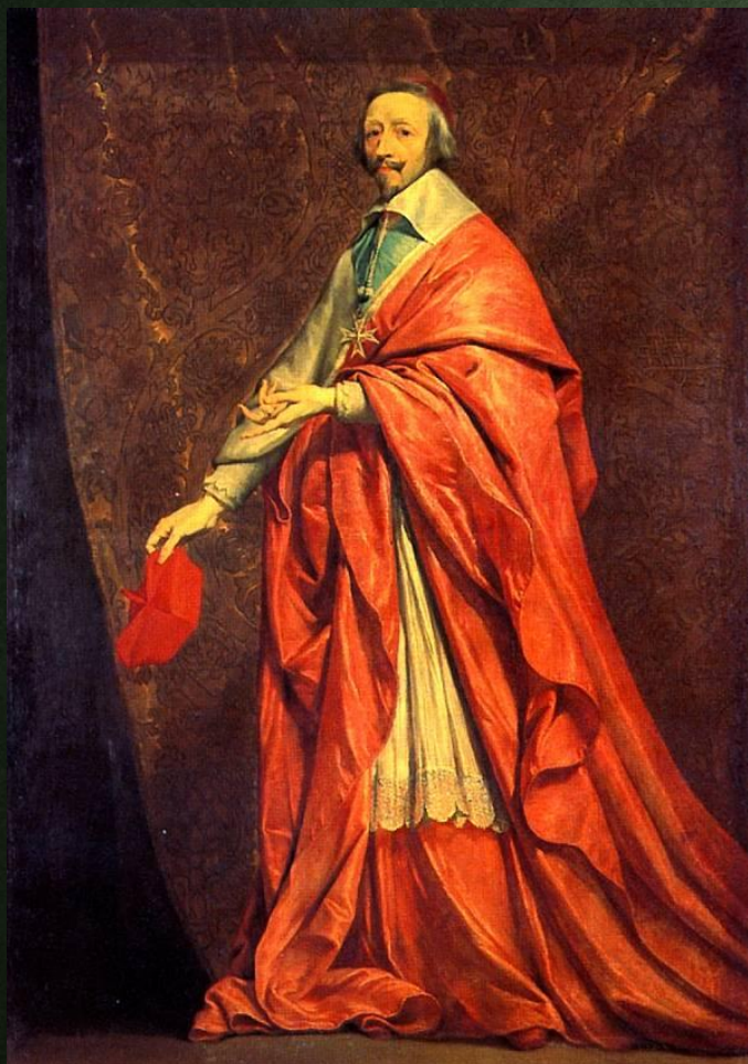
Арман Жан дю Плесси

Дипломатия должна быть предметом постоянной деятельности