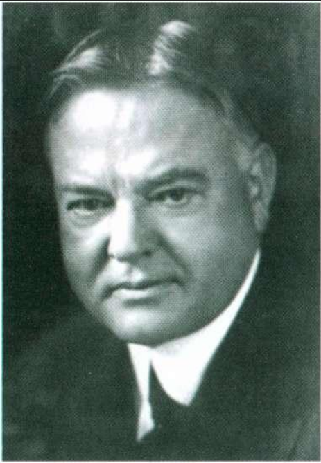
Герберт Гувер, 31-й президент США с 1929 по 1933 гг.

«Приближается кризис, попытаться избежать трудного положения, в котором могут оказаться США, можно лишь изменив расстановку сил в мире. Для этого надо оказать помощь России, чтобы она окончательно избавилась от разрухи – последствий Гражданской войны, и помочь Германии избавиться от тисков Версальского договора ... А потом надо столкнуть Россию и Германию лбами для того, чтобы, воспрянув после кризиса, США оказались один на один с оставшимся из противников».