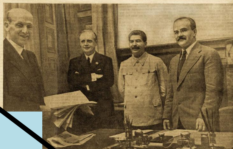
Митинг в честь подписания Договора о ненападении. На снимке (справа налево): тов. В. М. Молотов, тов. И. В. Сталин, тов. Риббентроп, тов. Гитлер.

Геополитическая система стран «Оси» , во главе с континентальной Германией, ставившая целью реализацию теории немецких геополитиков ( Ф. Ратцель, Р. Челлен , К. Хаусхоффер, К Шмитт) о государстве как живом организме, требующем в своём развитии расширения жизненного пространства, вплоть до планетарных масштабов, т.е. опять же установка на мировое господство.