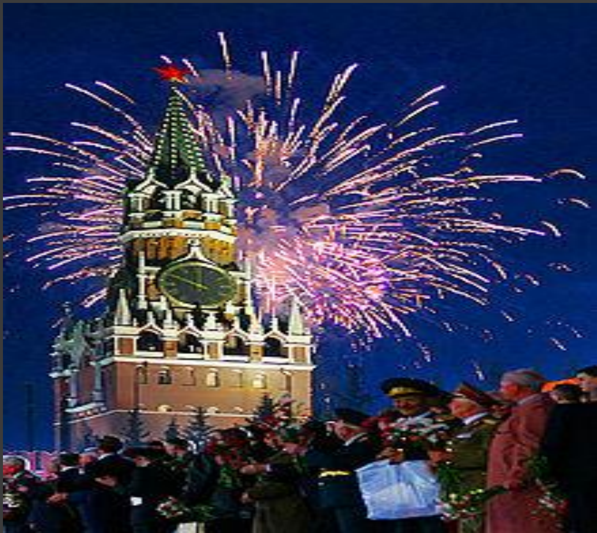
Праздничный салют в честь Дня Победы на Красной Площади.