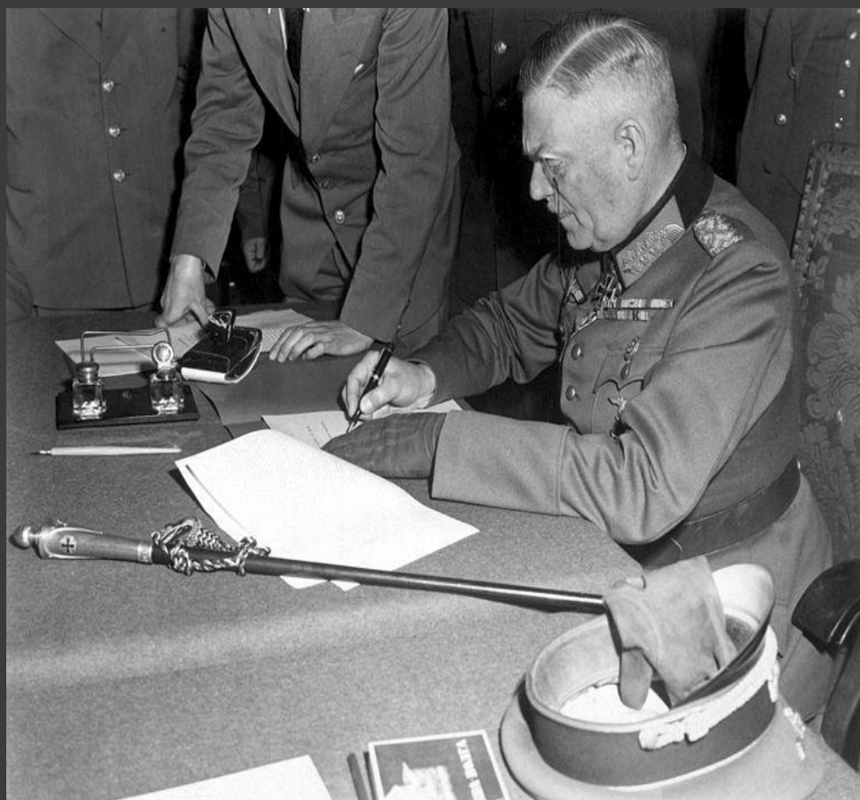
Генерал-фельдмаршал Вильгельм Кейтль подписывает Акт о безоговорочной капитуляции Германии