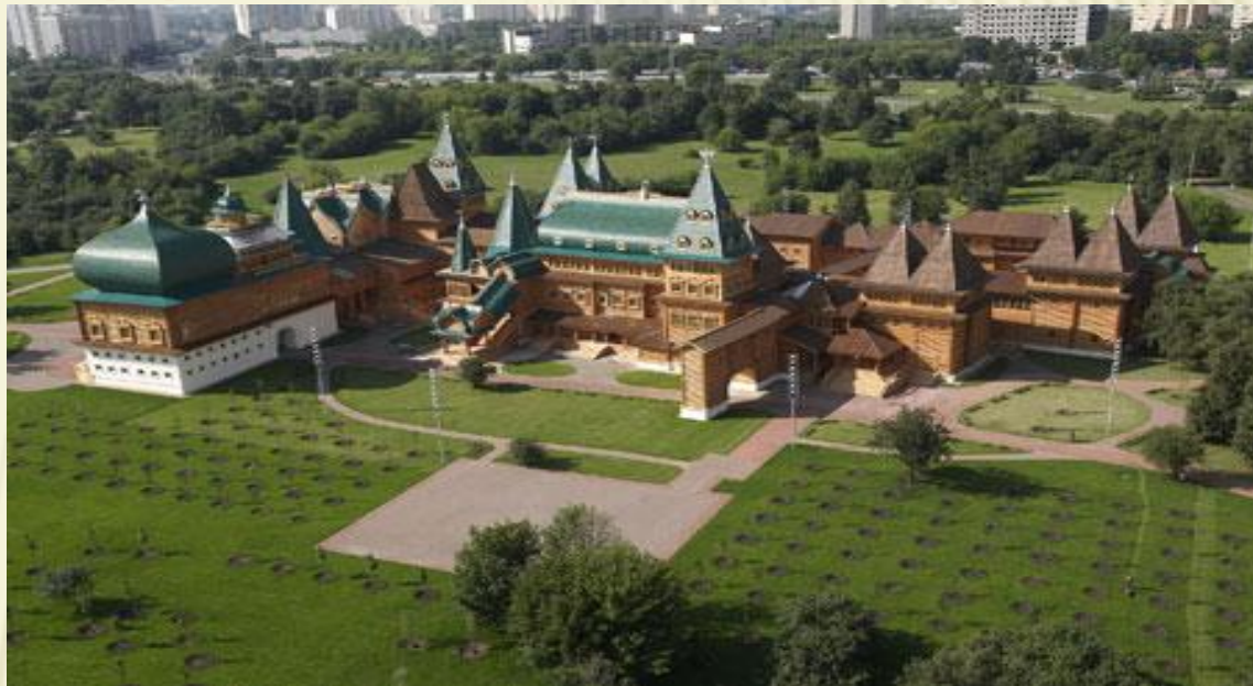
Дворец Алексея Михайловича. Коломенское.