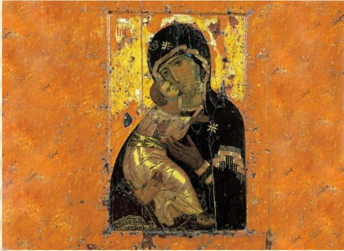
Икона Владимирской Богоматери