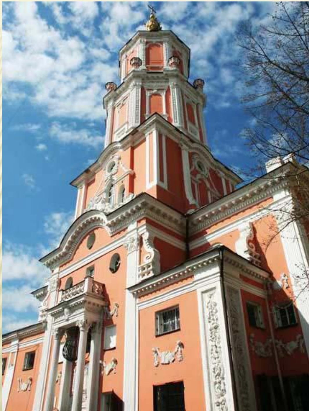
Храм Архангела Гавриила