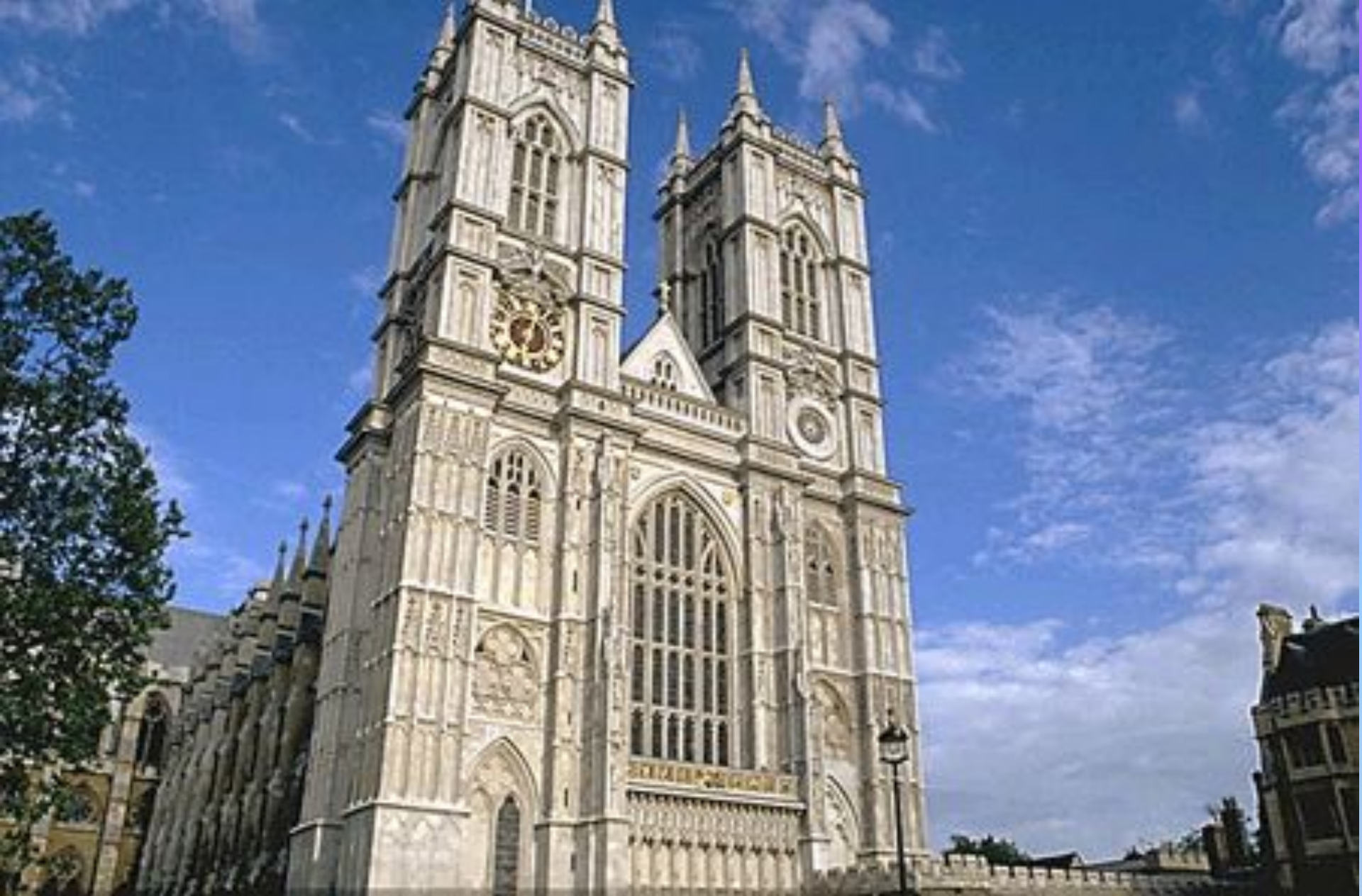
Самый знаменитый памятник английской готики – Вестминстерское аббатство.