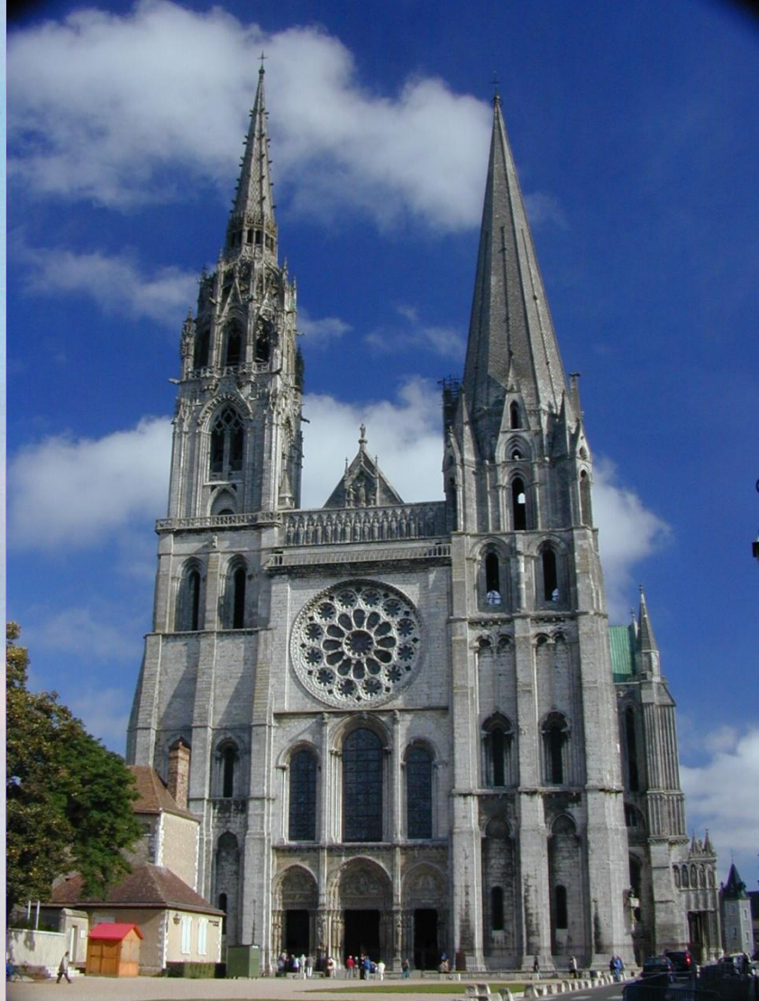
Соборы готического стиля