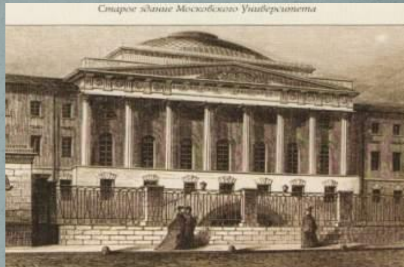
Московский университет (1831)