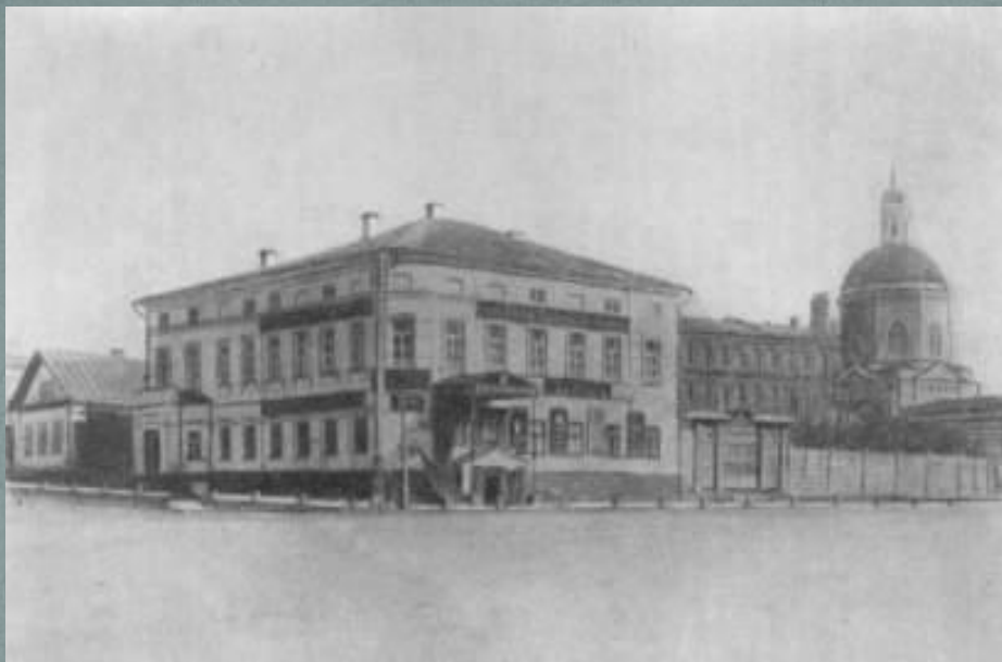
Частный пансион священника Троицкого