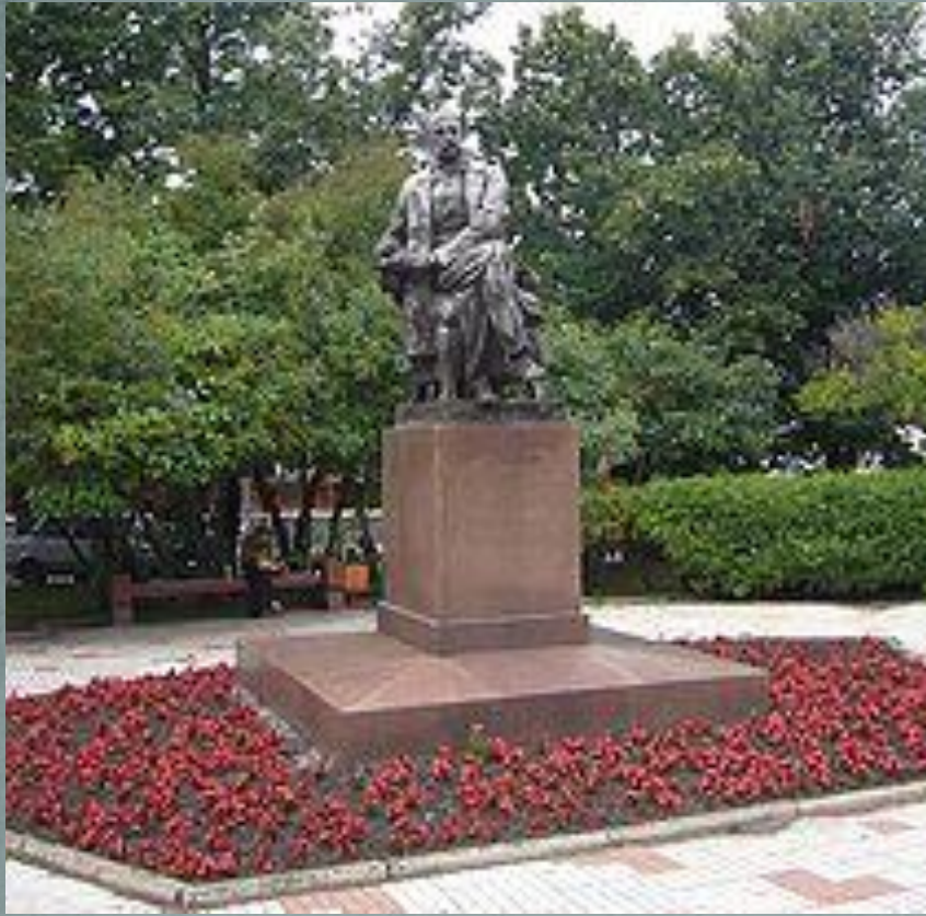
Памятник И.А. Гончарову в Симбирске.

Гончаров оставался в полном одиночестве и 12 (24) сентября 1891 года он простудился. Болезнь развивалась стремительно, и в ночь на 15 сентября он умер от воспаления легких на восьмидесятом году жизни. Иван Александрович был похоронен на Новом Никольском кладбище Александро-Невской лавры. В некрологе, опубликованном на страницах «Вестника Европы», отмечалось: «Подобно Тургеневу, Герцену, Островскому, Салтыкову, Гончаров всегда будет занимать одно из самых видных мест в нашей литературе»