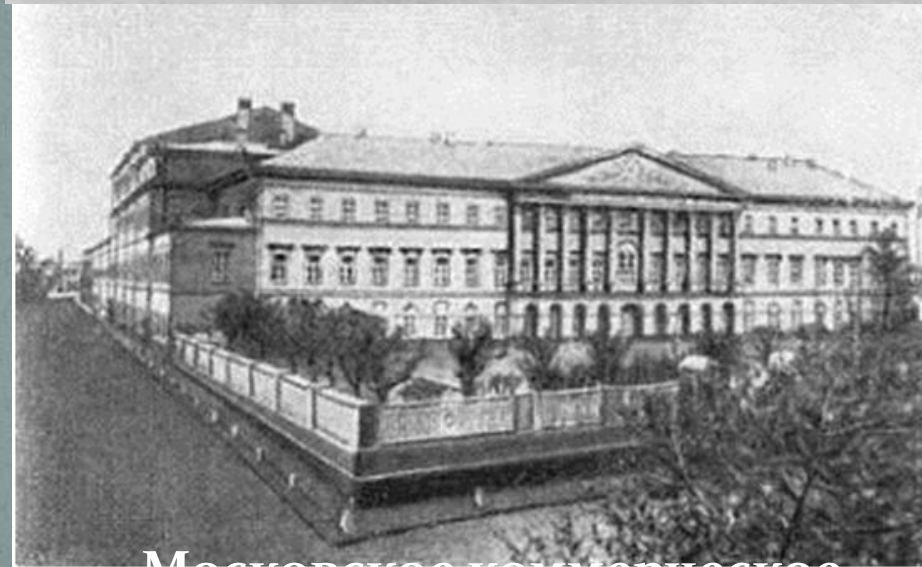
Московское коммерческое училище (1822)