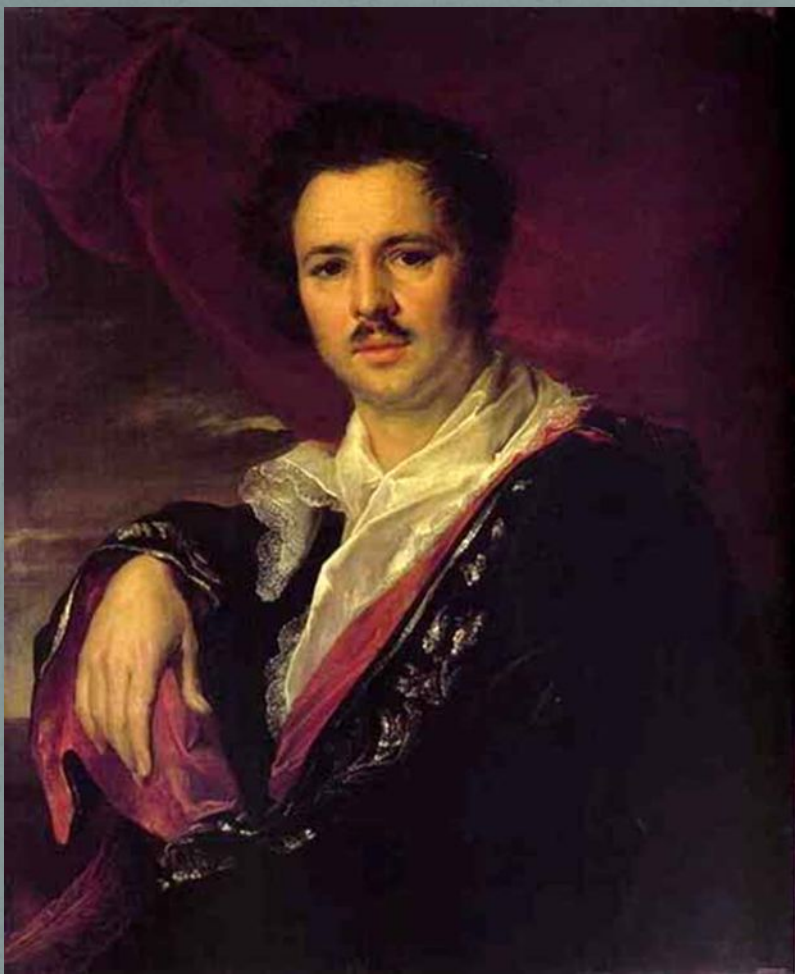
Майков Николай Аполлонович

Активно готовит себя к писательской деятельности