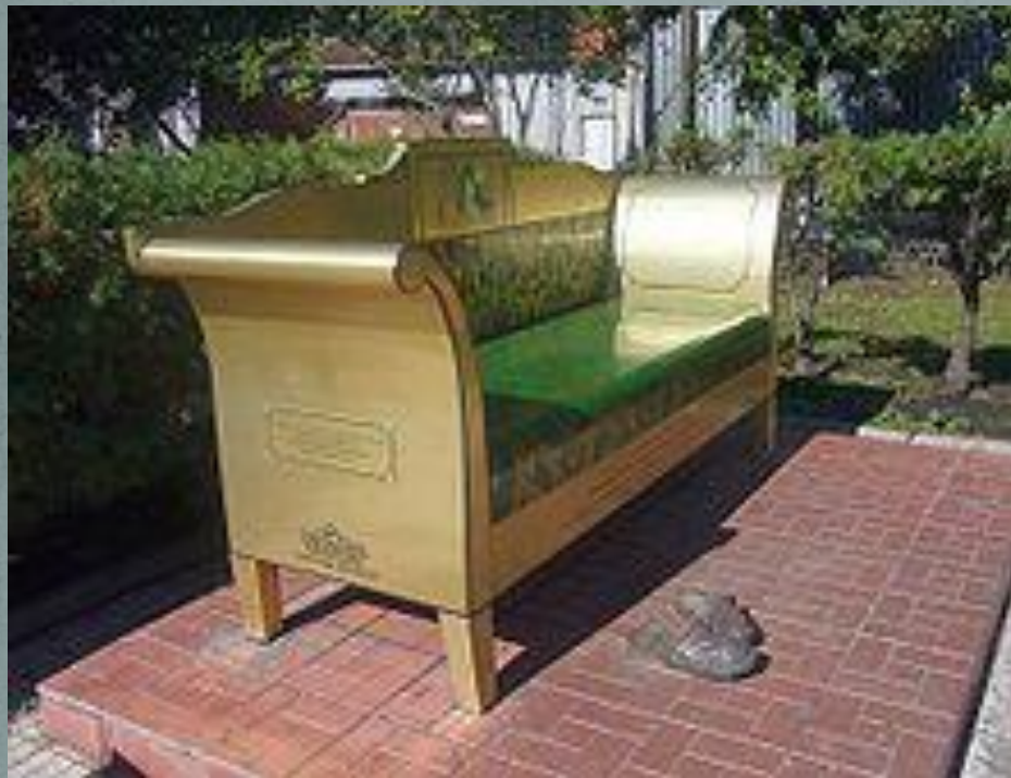
Диван и тапочки Обломова