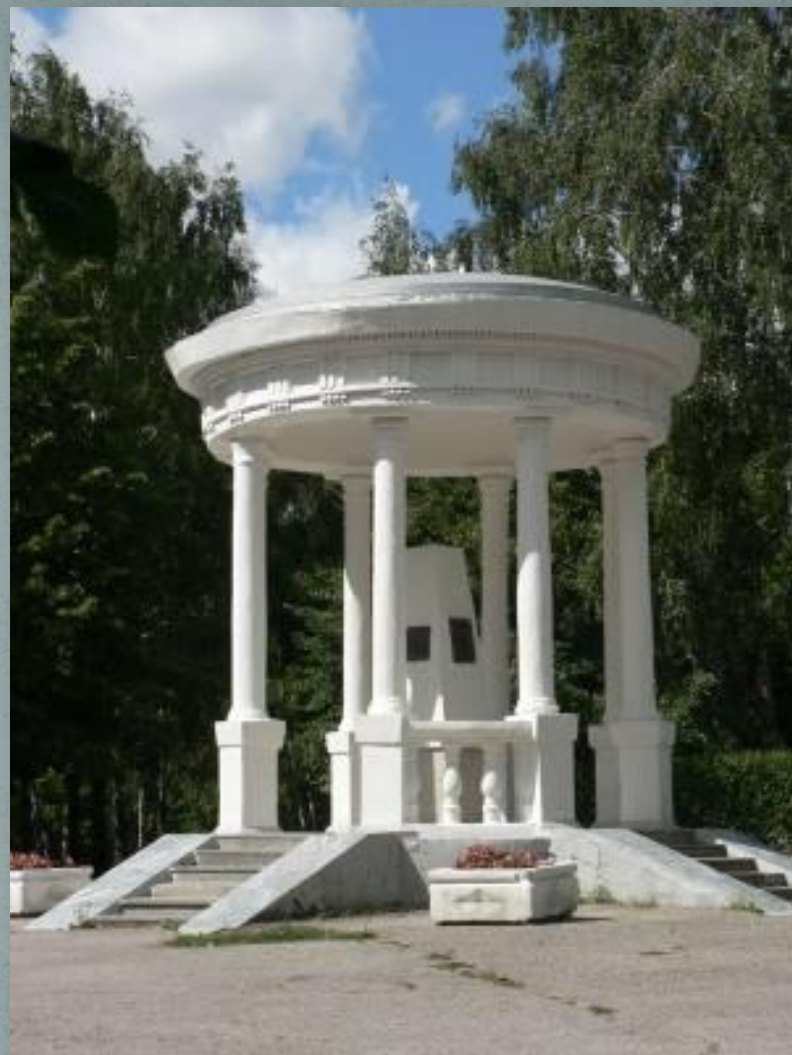
Мемориальная беседка И. А. Гончарова