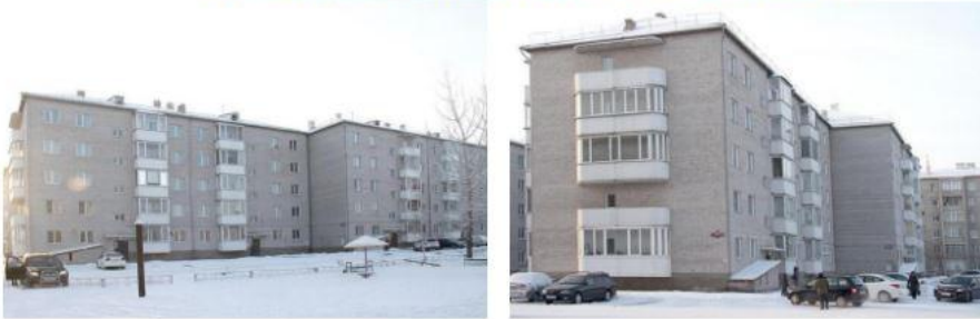
Группа домов по ул.Стофато, 4, 6А в г.Абакане