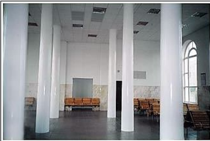
Железнодорожный вокзал станции Абакан