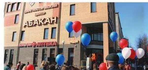
Диагностический центр «Абакан»