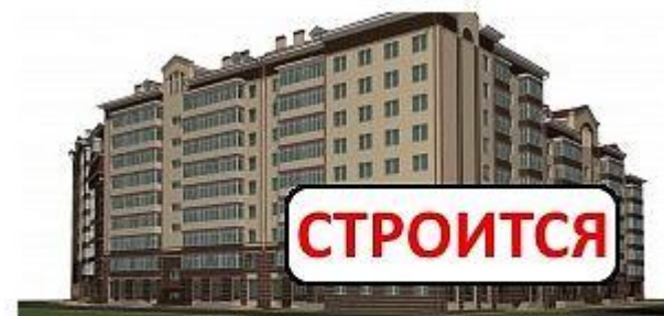
Некрасова 37, 1 очередь