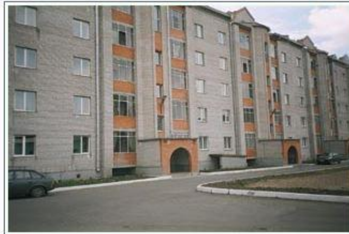
Жилой дом по ул.Вокзальная