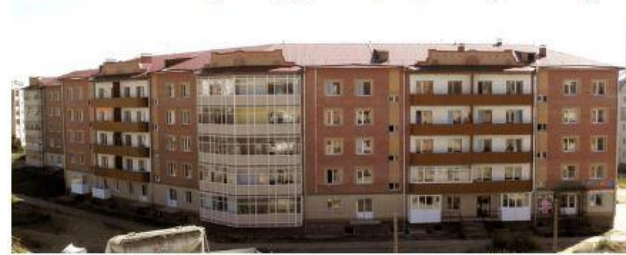
124-квартирный пятиэтажный жилой дом по улице Аскизская, 220 А в г. Абакане (площадь квартир 8366,3 кв.м.)