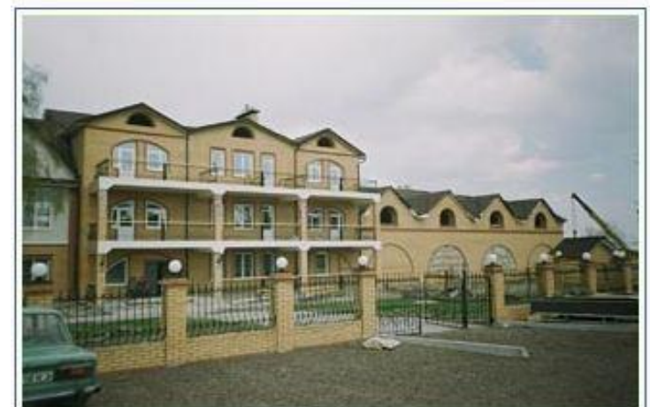
Корпус № 9 курорта «Озеро Шира»