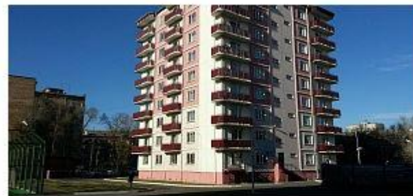
Студенческое общежитие ХГУ по ул. Ленина 90А