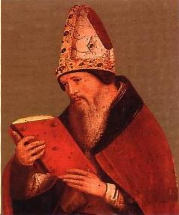
□ Августин Аврелий