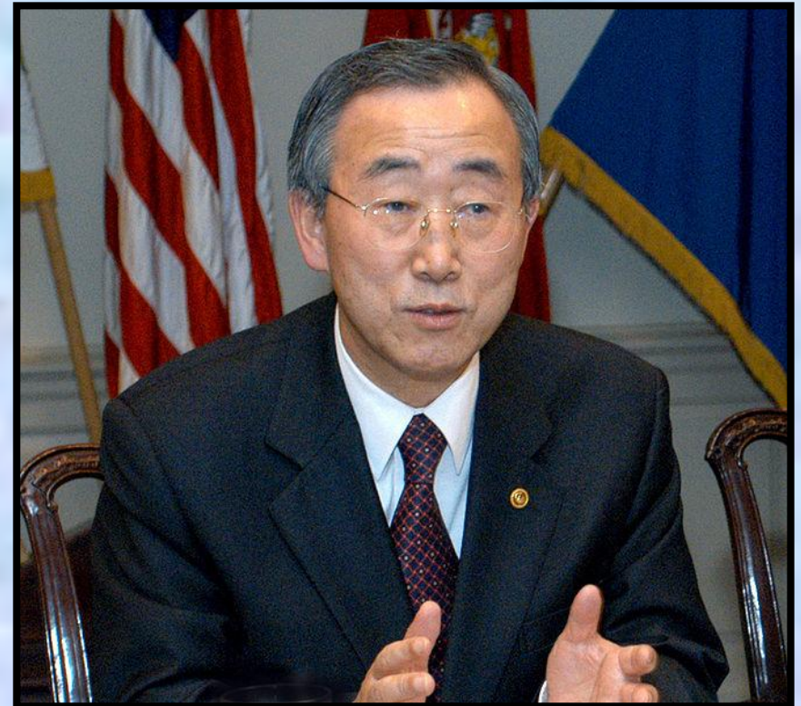
Пан Ги Мун